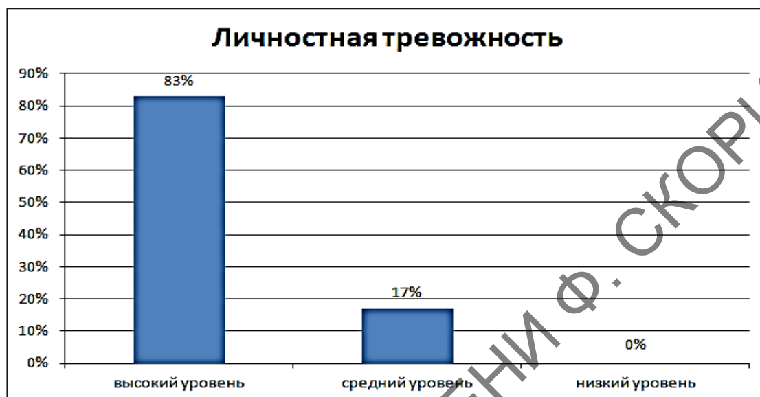
Рисунок 2 – Выраженность личностной тревожности у подростков (в %)

Результаты исследования личностной тревожности в подростковом возрасте представлены на рисунке 2.