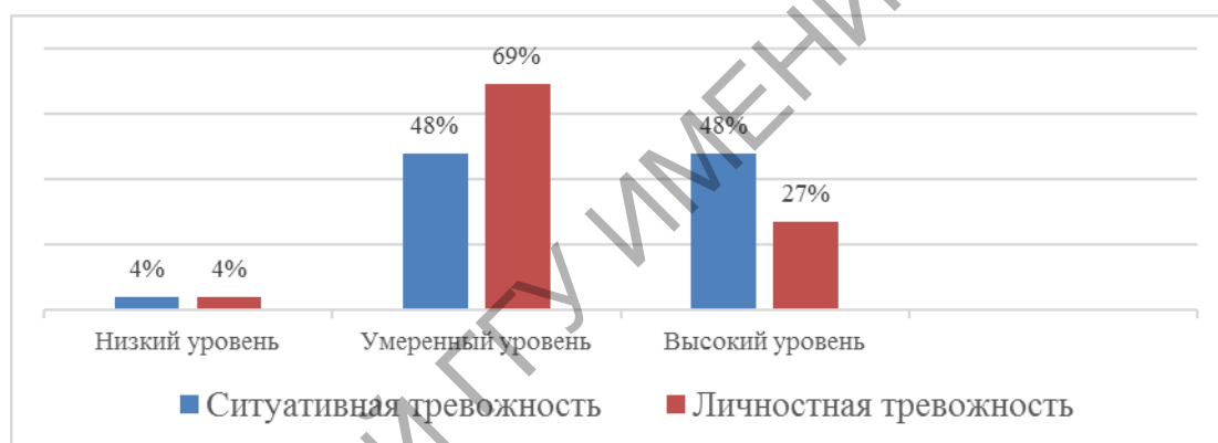
Рисунок 1 – Уровень тревожности подростков согласно самооценке уровня реактивной и личностной тревожности

Графически результаты исследования тревожности респондентов по шкале самооценки уровня реактивной и личностной тревожности Спилбергера-Ханина представлены в рисунке 1.