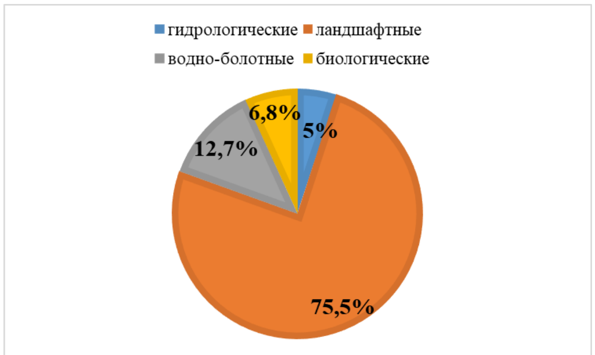
Рисунок 2 – Виды заказников на территории Припятского Полесья

Из 14 территорий Беларуси, включенных в список территорий, имеющих важное значение для сохранения диких птиц Европы, 11 расположены в Припятском Полесье и занимают 13,8 % от всей территории округа [1].