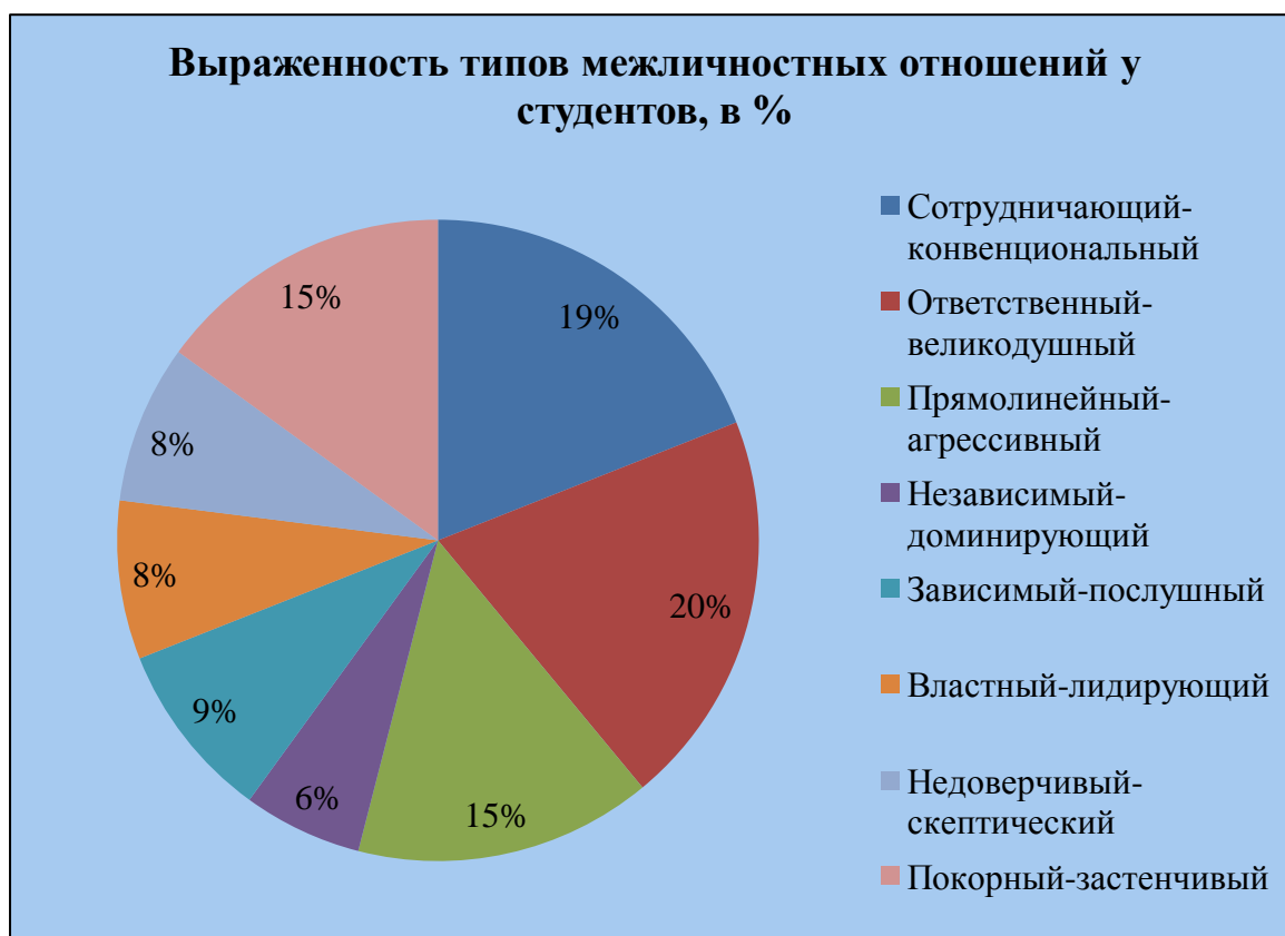
Рисунок 2 – Результаты исследования выраженности типов межличностных отношений у студентов (данные представлены в %)

Из рисунка 2 следует, что для 20 % студентов характерен ответственный-великодушный тип межличностных отношений. Такой вариант межличностного поведения проявляется выраженной готовностью помогать окружающим, развитым чувством ответственности. Свойственно альтруистическое поведение, гиперсоциальность установок, мягкосердечность, сверхобязательность.