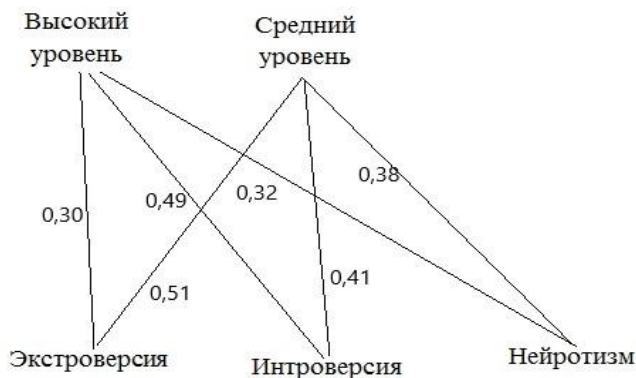
Рисунок 1 – Корреляционные плеяды склонности к риску и личностных особенностей юношей

Рассчитаем взаимосвязь склонности к рискованному поведению и личностных особенностей юношей с помощью коэффициент корреляции Ч. Спирмена. Полученные данные представлены на рисунке 1.