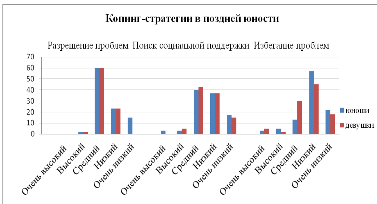
Рисунок 2 – Результаты по методике «Индикатор копинг-стратегий» у юношей и девушек» в поздней юности

Согласно полученным данным, представленным на рисунке 2, доминирующими копинг-стратегиями у юношей и девушек являются «Разрешение проблем» и «Избегание проблем».