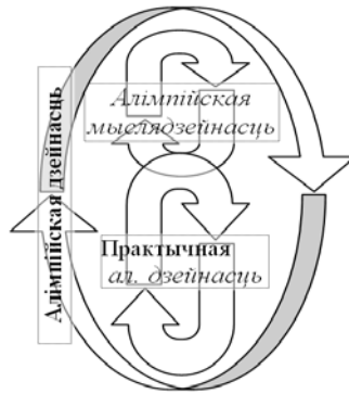
Малюнак 2 – Алімпійская дзейнасць складае своеасаблівы «ланцуг» з практычнай алімпійскай дзейнасці і алімпійскай мыслядзейнасці

Далейшае раскрыццё анталогіі алімпійскай дзейнасці патрабуе прад'яўлення механізмаў фармавання алімпійскай культуры і яе ўздзеяння на алімпійскую ідэю і алімпійскі рух. Для гэтага давядзецца па іншаму прадставіць схему алімпійскай дзейнасці і раскласці апошняю на два ўзаемазвязаныя структурна-функцыянальныя элементы: алімпійскую мыслядзейнасць і практычную алімпійскую дзейнасць (малюнак 2).