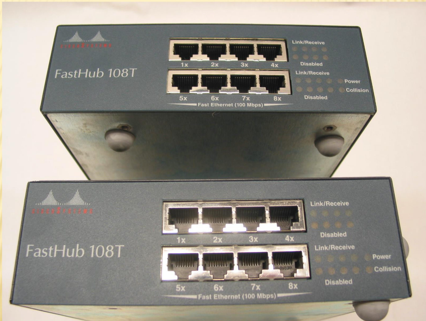
Концентратор Cisco Fasthub 108T