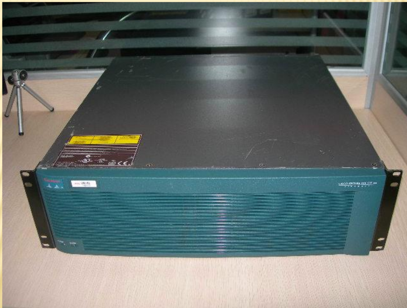
Аппаратный брандмауэр Cisco PIX серии 535