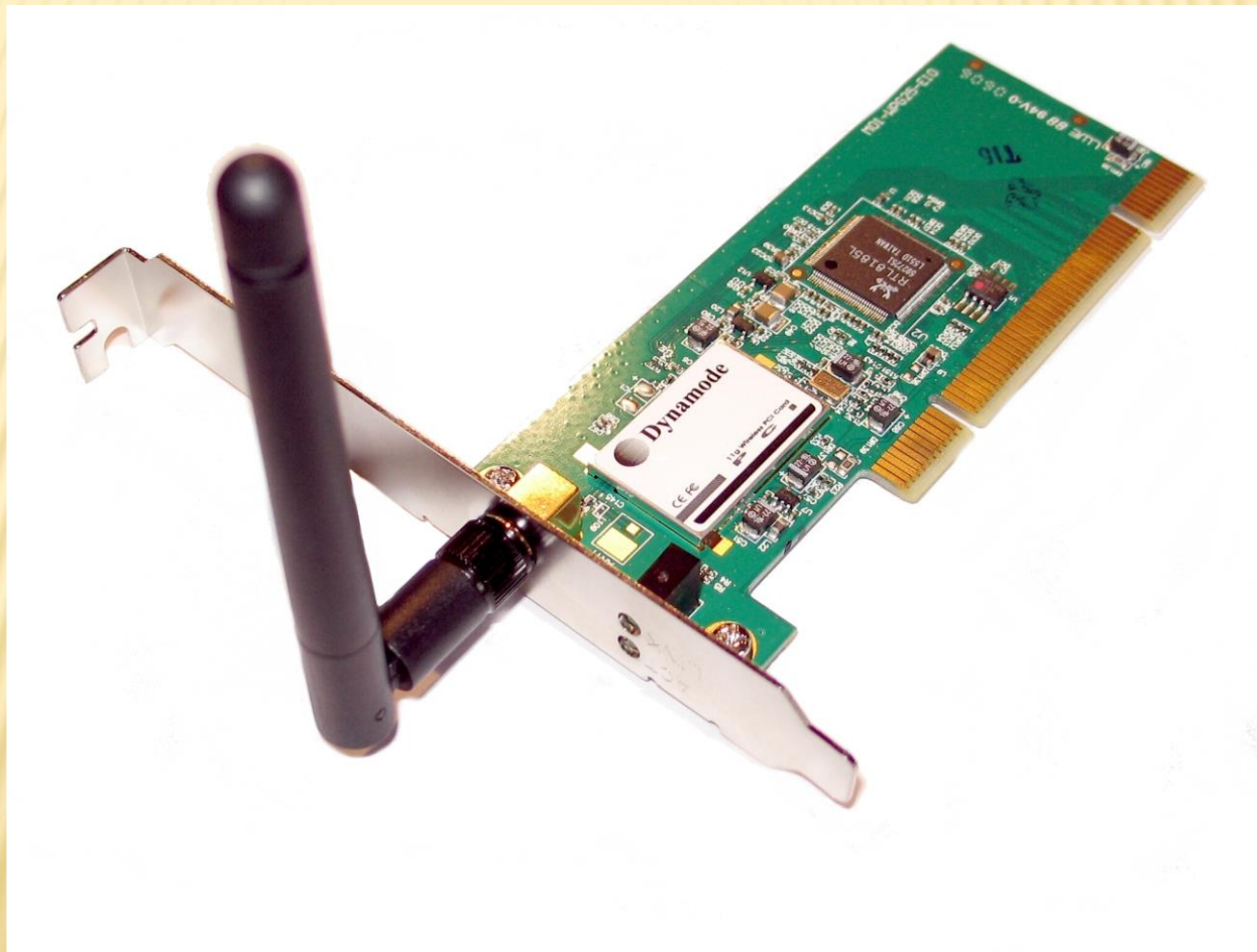
Беспроводной сетевой адаптер