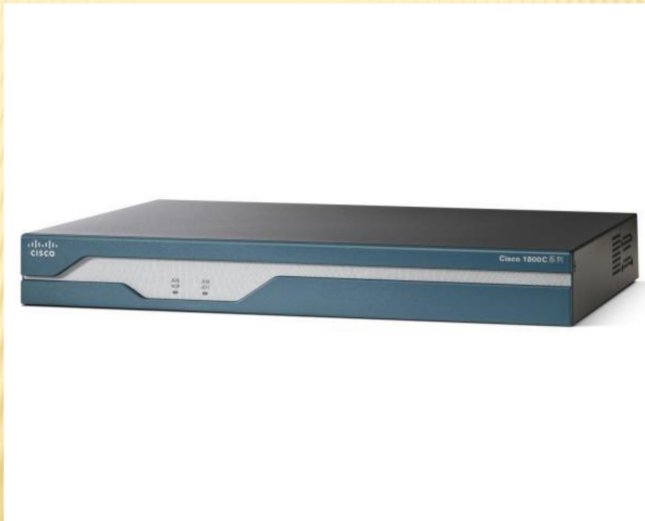
Маршрутизатор Cisco 1841