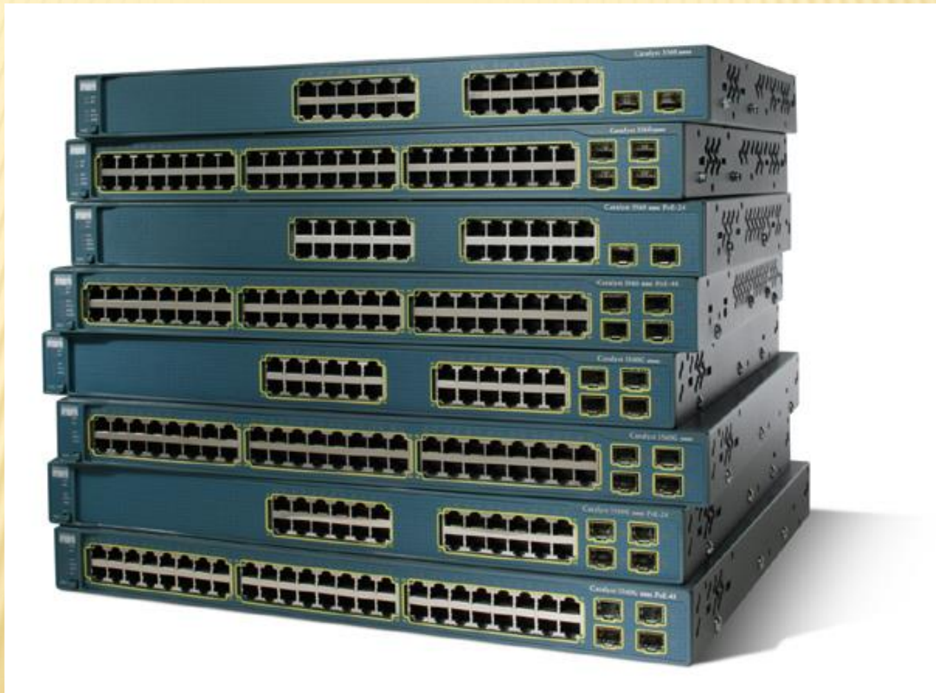
Коммутаторы Cisco серии Catalyst 6500