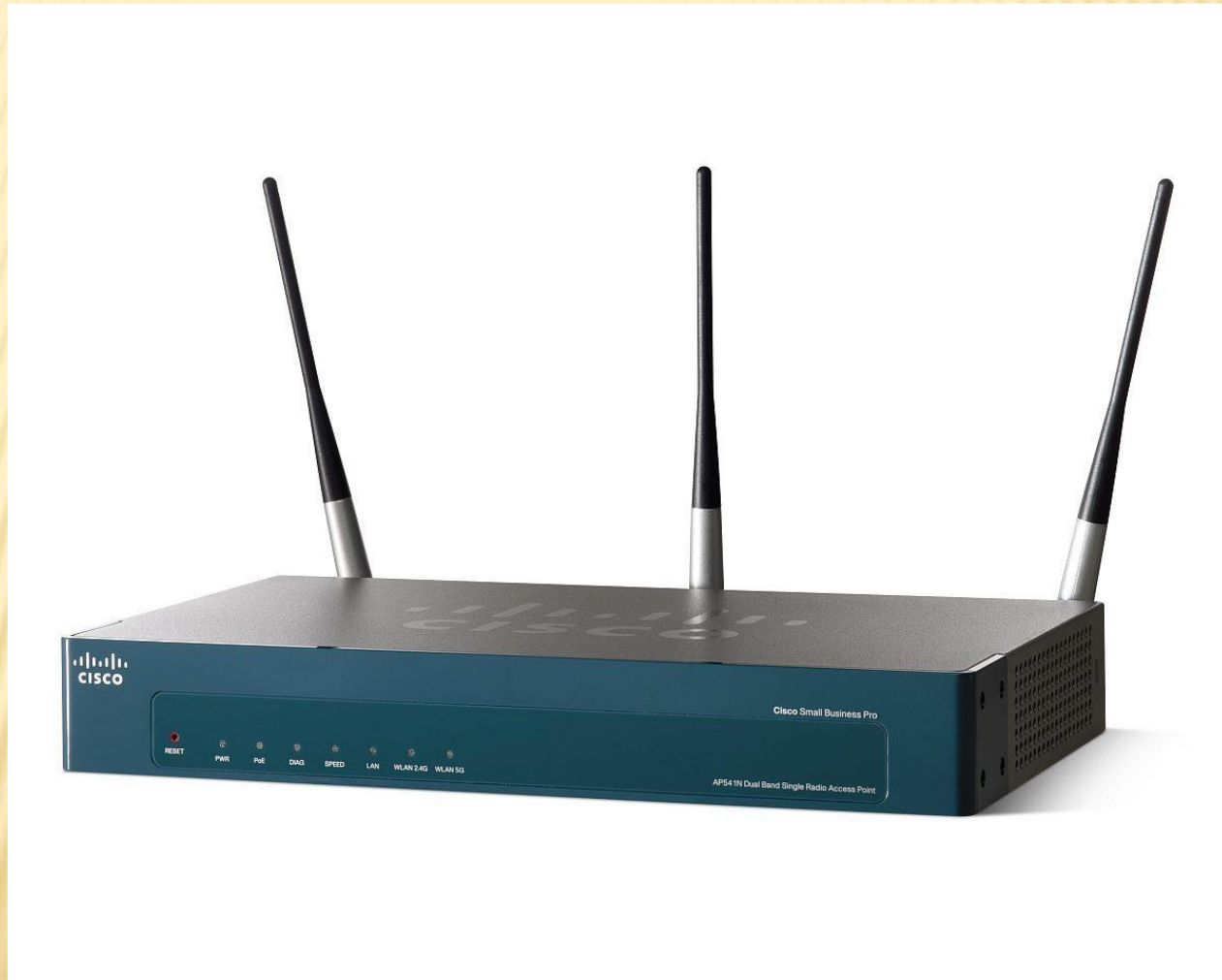
Точка беспроводного доступа Cisco AP 541N