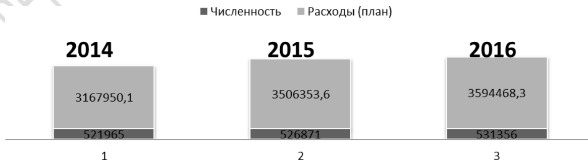
Рисунок 1 – Соотношения численности населения города Гомеля и расходов бюджета за 2014–2016 гг.

Данные таблицы 1 и рисунка 1 показывают, что рост численности населения влечет за собой и рост расходов бюджета. Однако темп роста расходов бюджета г. Гомеля (2015 г. к 2014 г. – 110,7 %; 2016 г. к 2015 г. – 102,5 %) выше, чем темп роста численности населения (2015 г. к 2014 г. и 2016 г. к 2015 г. – 100,9 %).