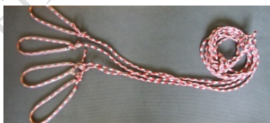
Рисунок 1 – Вид тренажёра – «летающий дракон»

Повысить эффективность физической подготовки можно путём применения специального тренажёра носящего символичное название «летающий дракон». Тренажёр представлен на рисунке 1–2.