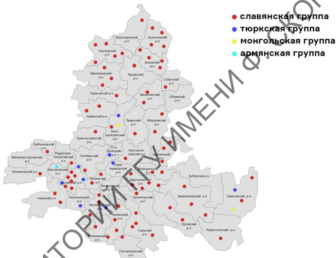
Рисунок 1 – Карта распространения сельскохозяйственных топонимов различных языковых групп (составлено авторами)

Учитывая полиэтническую историю заселения территории нынешней Ростовской области, стоит также рассмотреть пространственное распределение сельскохозяйственных топонимов различного языкового происхождения (Рисунок 1; Рисунок 2).