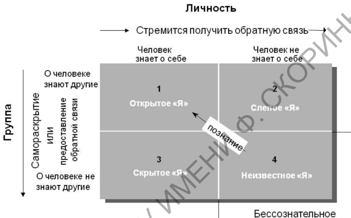
Рисунок – Диаграмма Джогари как метод самопознания

Для описания этой модели используется диаграмма «окно Джогари».