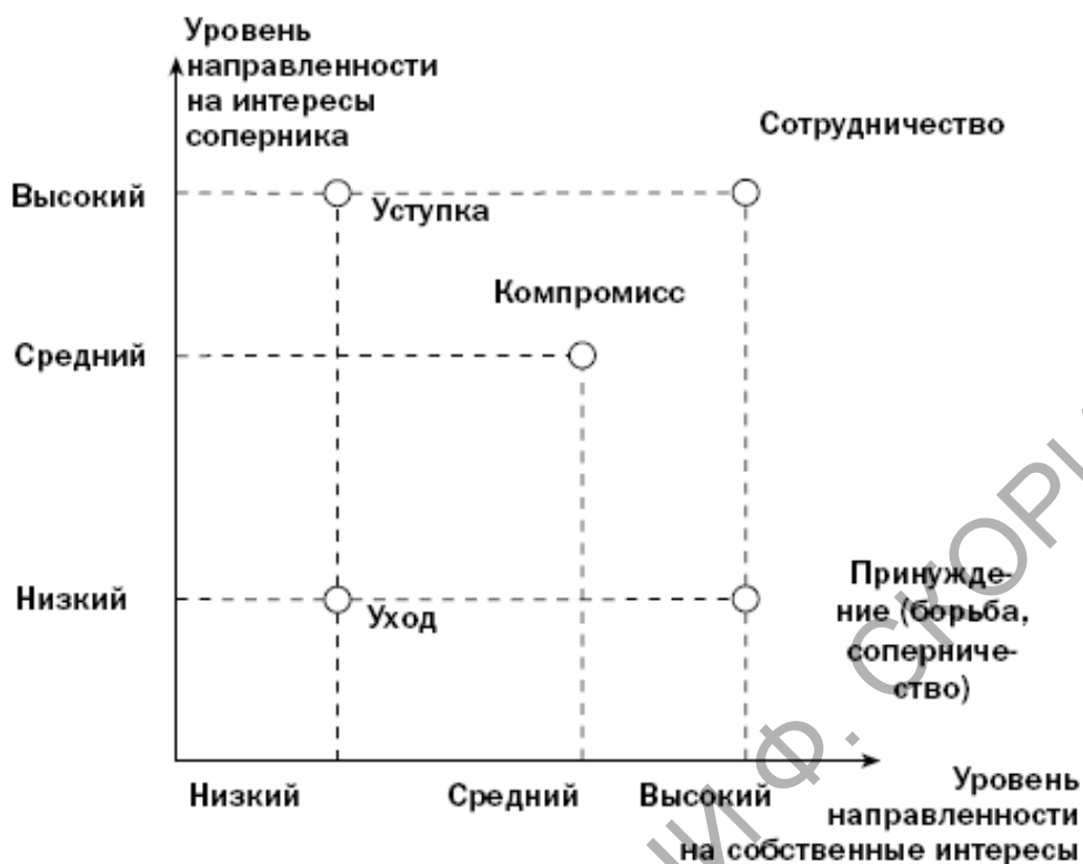
Рисунок 4.1 - Двухмерная модель стратегий поведения в конфликте Томаса-Килмена

При анализе конфликтов на основе рассматриваемой модели важно помнить, что уровень направленности на собственные интересы или интересы соперника зависит от трех обстоятельств: