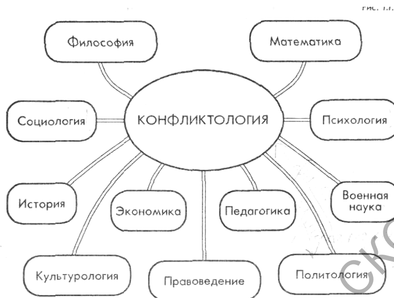
Рисунок 1.1 – Связь конфликтологии с другими науками