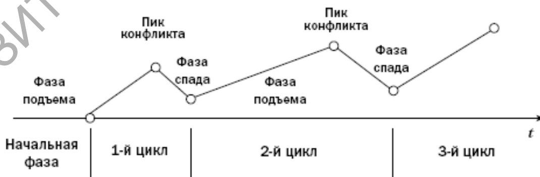
Рисунок 2.1 – Фазы конфликта

Важно помнить, что фазы конфликта могут повторяться циклически. Например, после фазы спада в 1-м цикле может начаться фаза подъема 2-го цикла с прохождением фаз пика и спада, затем может начаться 3-й цикл и т. д. При этом возможности разрешения конфликта в каждом последующем цикле сужаются. Описанный процесс можно изобразить графически (рисунок 2.1).