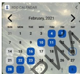
Рисунок 2 – Виджет

Также был разработан Android Widget в виде календаря (рисунок 2) и свернутом виде (рисунок 3).