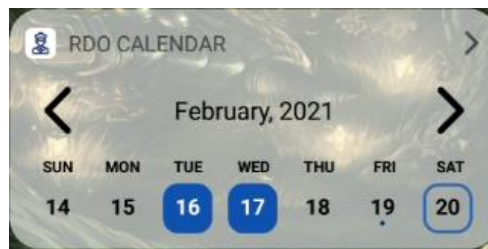
Рисунок 3 – Свернутый виджет

Сделана обработка всех возможных критических ситуаций для обеспечения стабильной работы.