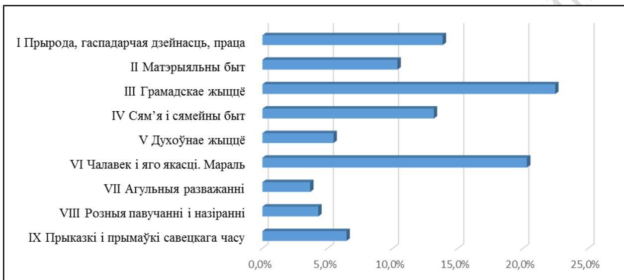
Рисунок 1 – Тематическое членение и объем ТО в словаре белорусских паремий

Как показывает проведенное автором статьи сопоставительное исследование тематически организованных паремиологических словарей четырех европейских языков [1], некоторая доля субъективности, проявляющаяся при выделении составителями словарей крупных блоков и разделов тематических объединений паремий (далее ТО), не снижает значимости выводов, которые могут быть сделаны на основании статистической обработки словарных материалов. Ниже приведены диаграммы, по которым можно судить о степени корреляции, к примеру, структуры словаря белорусских паремий (составитель М. Я. Гринблат) [2] и словаря итальянских паремий (составители В. Боджоне и Л. Массорбио) [3].