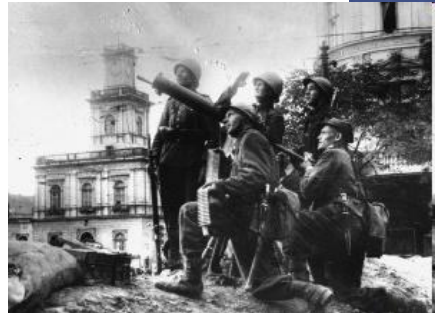
Защитники Варшавы, 1939 г.