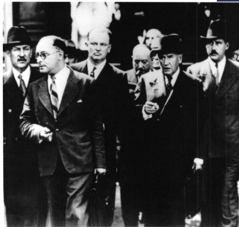
Премьер-министр Франции Эдуард Даладьё (второй справа) и его кабинет министров возвращаются из Елисейского дворца 2 сентября 1939 после принятия решения о всеобщей мобилизации.