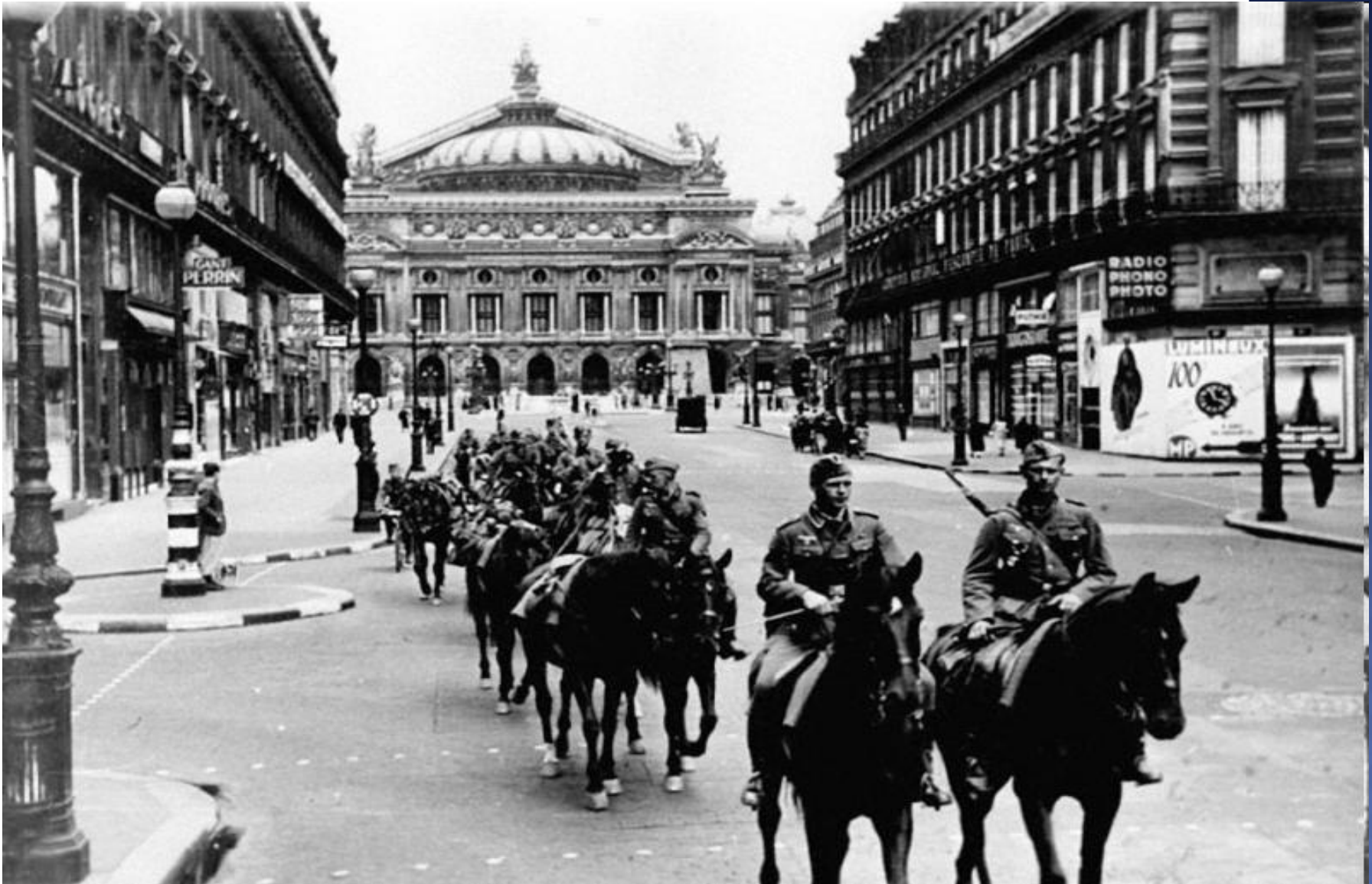
Немецкий конный патруль на одной из улиц Парижа