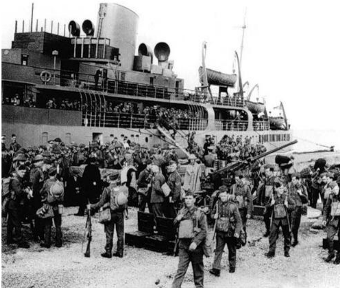
Британский экспедиционный корпус