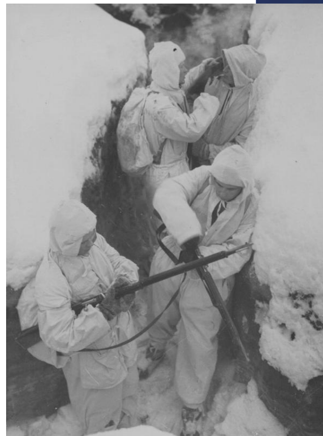
Четверо финских пехотинцев в окопе.