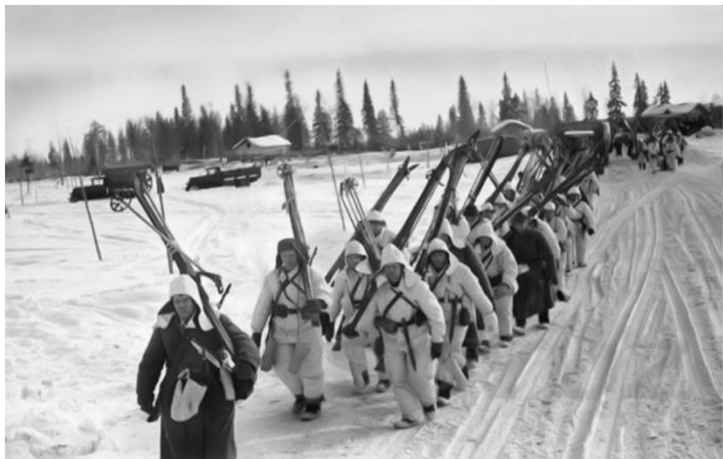
Советские лыжники выдвигаются на передовые позиции. Зима 1939—1940 годов.