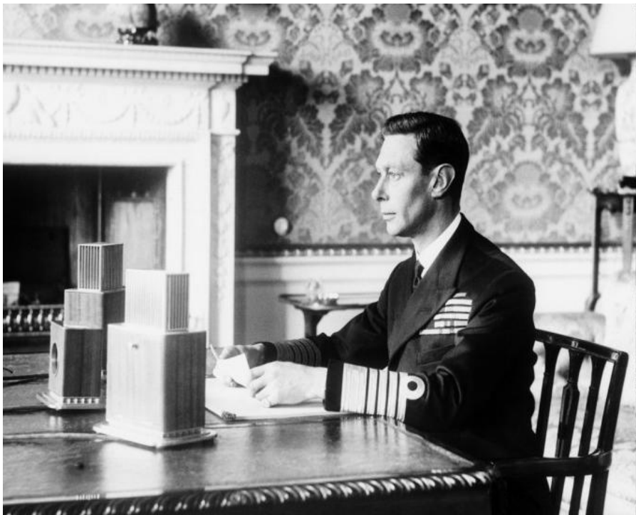
Британский король Георг VI выступает с обращением к своему народу. 3 сентября 1939, Лондон.