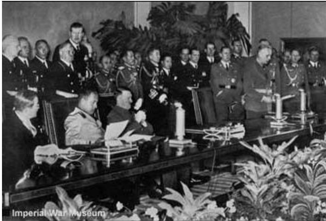
На фото представители делегаций Германии, Италии и Японии при заключении Тройственного пакта (Берлин, 1940)