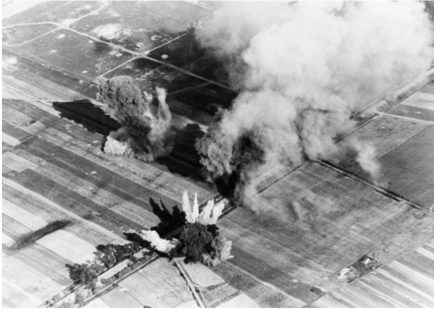
Бомбардировка на территории Польши, сентябрь 1939 г.