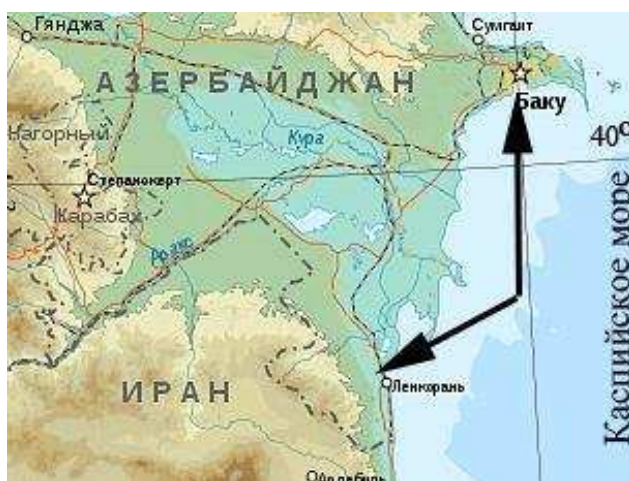
Рисунок 1. Районы основных мест поимок ежей с территории Азербайджана

Материалом для работы послужили личные сборы авторов при выполнении диссертационных исследований [8, 9], а также коллекционный фонд из зоологических музеев Белорусского государственного университета (г. Минск), Института Зоологии НАН Азербайджана и медицинского университета в г. Баку. Обследовано 231 черепов взрослых (перезимовавших) белогрудых ежей ( Erinaceus concolor s. l.) со всех областей Беларуси (основная выборка – по Гомельской), 18 черепов белогрудых ежей ( E. concolor s. l.) и 25 черепов ушастого ежа – Hemiechinus auritus (Gmelin, 1770) – с Азербайджана (в основном – Ленкоранский район и Апшеронский полуостров – регионов Каспийского моря, рисунок 1).