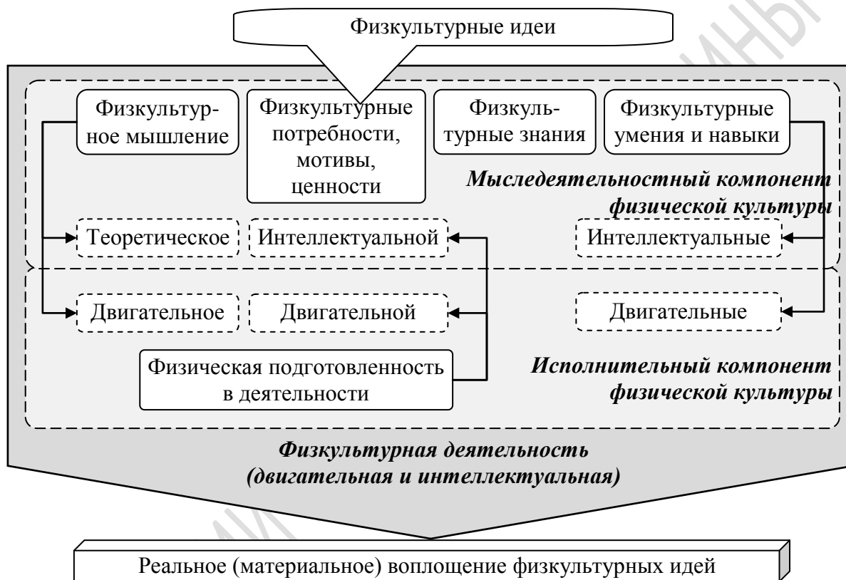
Рисунок 1 – Модель физической культуры личности человека

В структурном отношении физическая культура является системно организованным единством физкультурного мышления и знаний, физкультурных потребностей (мотивов и ценностей), физкультурных умений (навыков), физической подготовленности объединенных физкультурной деятельностью [4; 5]. Перечисленные элементы объединяются в два компонента физической культуры: мыследеятельностный и исполнительный (рисунок 1).