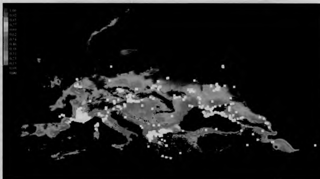
Рис. 3. Графический результат пространственного моделирования ареала C. rhoeadifolia , полученный в программе MaxEnt

Проанализировав графический результат пространственного моделирования ареала C. rhoeadifolia (рис. 3), можно убедиться, что климатические условия Беларуси не являются приемлемыми для данного таксона (оттенками синего цвета показаны территории с неблагоприятными климатическими условиями для вида).