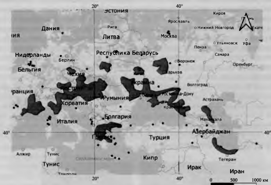
Рис. 2. Общий ареал C. rhoeadifolia Fig. 2. General range of C. rhoeadifolia

Скерда маколистная является евроазиатским субпонтическим видом. Основные популяции C. rhoeadifolia сосредоточены на южном и западном побережьях Каспийского моря, в Причерноморье и Крыму, на побережье Азовского моря, в Поднепровье Украины, в южной части Балканского полуострова, на юго-востоке Франции и в Центральной Европе. C. rhoeadifolia произрастает в Верхней Силезии и районе Гроссштайна (юго-запад Польши), Чехии, низменности Эльбы (Германия), отмечена в Мангейме, Людвигсхафене и Мюнхене, часто встречается в Австрии [22, S. 1175].