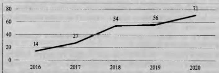
Рисунок 2. Количество оказанных электронных услуг и административных процедур посредством ОАИС, на 100 человек населения (в единицах)

Безусловно, перечни оказываемых электронных услуг и административных процедур будут и дальше расширяться с целью удовлетворения потребностей общества. Процесс перехода в Республике Беларусь к электронному правительству следует считать неизбежным, поскольку наблюдается постоянный рост объема предоставляемых электронных услуг.