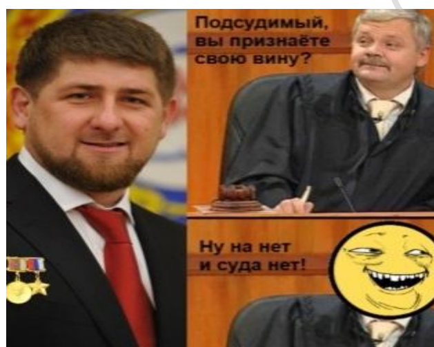
Рисунок 6 – Мем-комикс 6 [13]

В вербальной части таких креолизованных единиц пословица На нет и суда нет – это часть диалога или трилога. Эти слова произносит судья после того, как он услышал отрицательный ответ подсудимого. Подсудимыми могут быть участники судебных шоу (см. мем-комикс 3), известные политические деятели – Кадыров Рамзан Ахматович (см. мем-комикс 6) и Янукович Виктор Фёдорович (см. мем-комикс 4), персонажи яростных комиксов – «Me gusta» (мем-комикс 5) [14], название которого переводится с испанского как «Мне нравится».