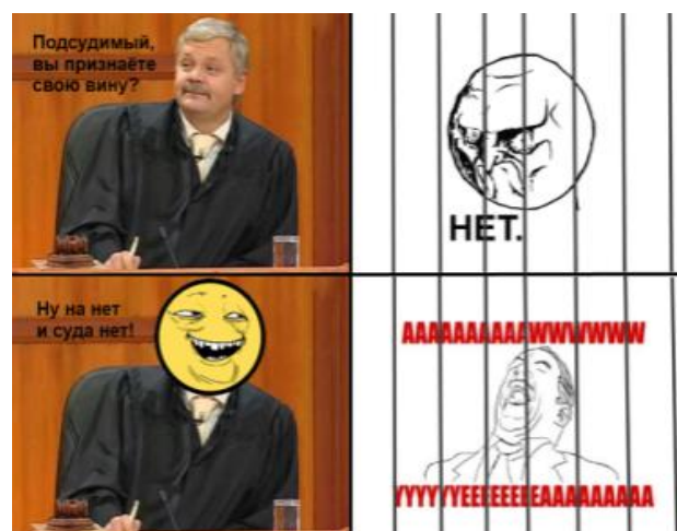
Рисунок 5 – Мем-комикс 5 [12]