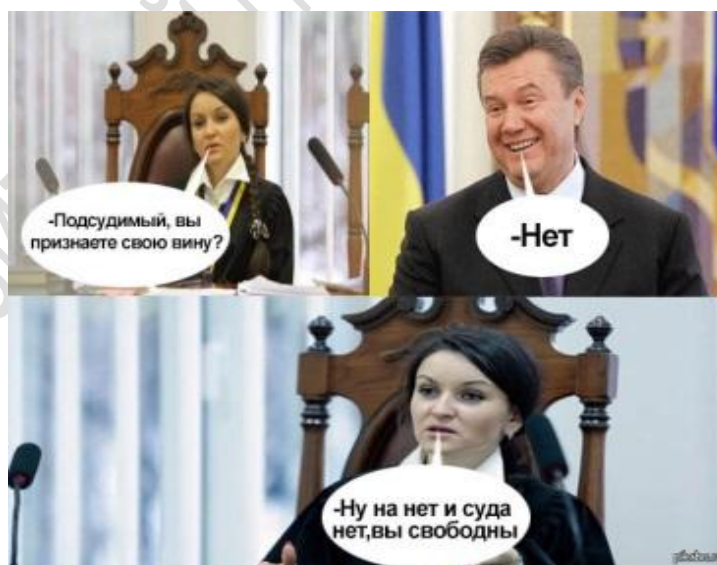
Рисунок 4 – Мем-комикс 4 [11]