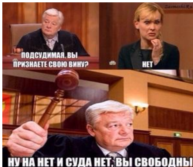
Рисунок 1 – Мем-комикс 1 [7]