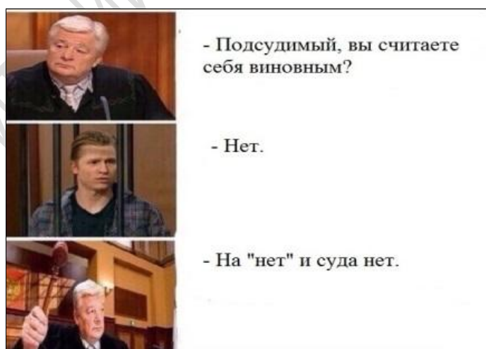
Рисунок 2 – Мем-комикс 2 [8].

Выход на экраны телепередач, подобных «Суду присяжных» (в Украине на канале ИНТЕР транслировалось судебное шоу «Судеб-