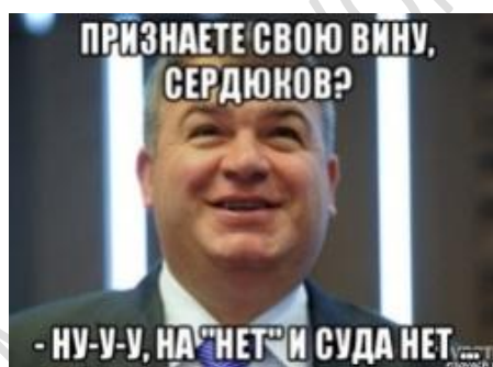
Рисунок 10 – Интернет-мем 4 [22] Рисунок 11 – Интернет-мем 5 [23]

4. Паремия На нет и суда нет употребляется в вербальной части интернет-открыток, которая построена в виде диалога между судьёй и подсудимым. Иконическая часть визуализирует разговор полностью (изображены два участника диалога) или частично (нарисован только судья).