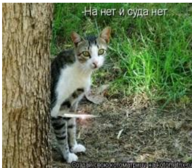
Рисунок 15 – Котоматрица [27].

Изобразительная часть данной котоматрицы [27] срежиссирована (кот выглядывает из-за дерева и держит в лапе нож), а вербальная часть представлена поговоркой, которую «произносит» персонаж. Котоматрица напоминает слова из песни, прозвучавшей в фильме «Приключения Буратино»: «Какое небо голубое, / Мы не сторонники разбоя: / На хвастуна не нужен нож, / Ему немножко подпоёшь / И делай с ним, что хошь» [28].