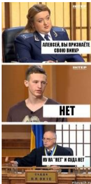
Рисунок 3 – Мем-комикс 3 [10]

ные дела» [9] и другие), способствовал появлению серии мемов-комиксов, построенных по образцу мема «Полностью оправдан».