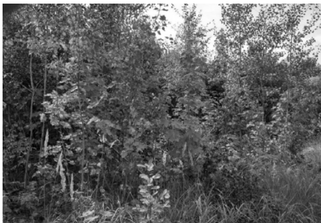
Рисунок 3 – Дубрава орляковая (Козелужское лесничество Хойникского лесхоза, кв. 11, выд. 8)

Наибольшее внимание лесоводов уделяется молоднякам дуба, особенно 1 класса возраста, когда формируется состав будущей дубравы. В этот период без должного ухода за дубом и его породами-спутниками, к которым относятся клен, липа, вяз, ясень, вероятность нежелательной смены пород второстепенными древесными видами особенно велика. В лесхозах подзоны широколиственно-сосновых лесов в наиболее распространенных кисличных, орляковых, черничных, а также снытевых типах дубовых лесов были заложены пробные площади с различной долей участия дуба (2–10 единиц состава). Фотографии некоторых объектов представлены на рисунке 3 и 4.