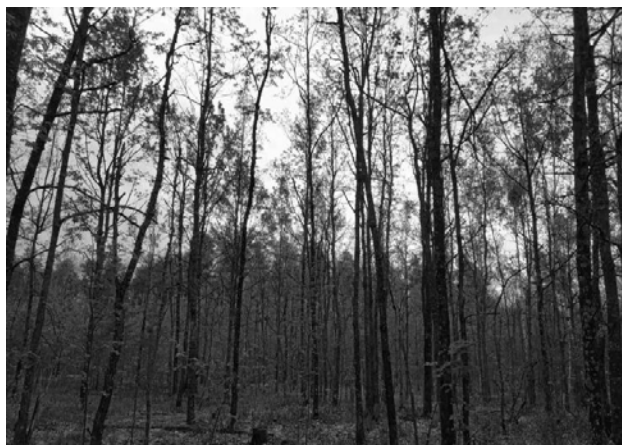
Рисунок 4 – Дубрава кисличная (Речицкое лесничество Речицкого опытного лесхоза, кв. 6 выд. 14)

По материалам пробных площадей в наиболее продуктивных дубравах кисличных и снытевых типов леса рассчитаны средние составы по числу стволов и по запасу для молодняков 1 класса возраста в разрезе возрастных групп 5–10 лет и 11–20 лет (таблица 2).