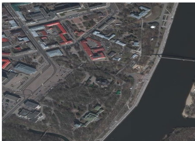
Рисунок 1 – Спутниковая карта дворцово-паркового ансамбля

Достопримечательности включают в свой состав многие объекты. Если говорить о цифрах, то здесь находится по меньшей мере 9 отдельных элементов, среди которых имеется: