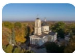
Собор святых Петра и Павла