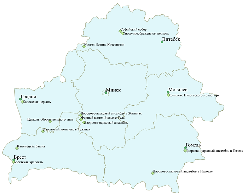
Рисунок 2 – Гомельский дворцово-парковый ансамбль на карте Беларуси