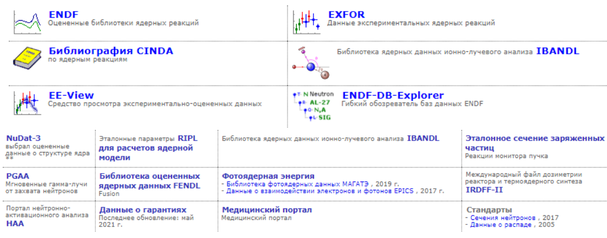
Рисунок 2 – Поисковые системы баз данных [1]

А также библиотек данных для скачивания: NGATLAS, IBANDL, FENDL, IRDF-II, PADF 2007, Tendl2019, RNAL, ADS-Lib, Архив ENDF, PIGE, DXS, Empire-3.2.3 /2023, EXFOR-X5, TENDL-2021, ИМПЕРИЯ-3.2 и другие.