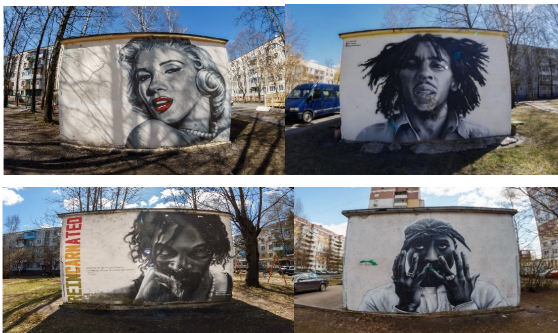
Рисунок 6 – Стрит-арт портреты знаменитостей, Витебск [8]

В Витебске самым узнаваемым является мурал расположенный на 12-этаже, «Простора натхнення» [7]. Создан он был в рамках совместного проекта «Беларусбанка» и арт-сообщества «Urban Myths». Интересным стрит-артом являются портреты знаменитостей, таких как: Мэрлин Монро, Snoop Dogg , Tupac , Юрий Гагарин, Боб Марли [8], выполненные на стенах трансформаторных подстанций (рисунок 6).