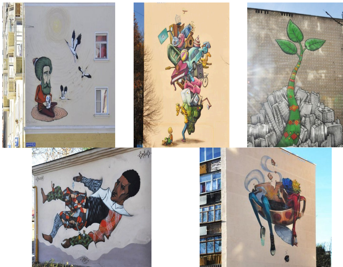
Рисунок 4 – Железнодорожный район стрит-арт