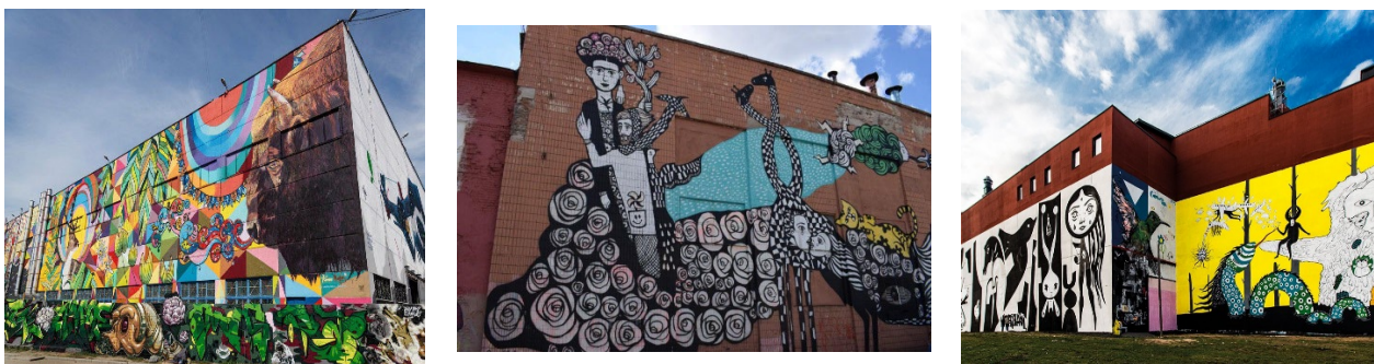
Рисунок 1 – Стрит-арт улица Октябрьская [3]

Большей частью граффити Минск обязан фестивалям. В 2014-м году в Минске впервые прошел урбан-фестиваль Vulica Brasil , с этого времени в столице и начали регулярно появляться новые муралы. Идея белорусско-бразильского фестиваля заключалась в том, чтобы художники со всего мира вместе с белорусами украшали стены города своими рисунками. За 4 года в Минске побывали десятки граффитистов из разных стран, улица Октябрьская изменилась до неузнаваемости [3], да и на других центральных улицах города появилось много ярких и оригинальных муралов.