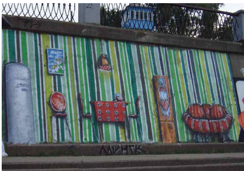
Рисунок 2 – Набережная реки Сож [4]

Стрит-арт набирает популярность и в других городах Беларуси. Настоящий бум гомельского стрит-арта наблюдался в 2000 годы. В августе 2003 года прошел международный фестиваль граффити Meeting of Styles , эпицентром которого стала бетонная стена на набережной реки Сож, рисунок 2 [4]. На протяжении нескольких дней уличные художники из Беларуси, России, Украины и Германии создавали единые композиции на тему здорового образа жизни.