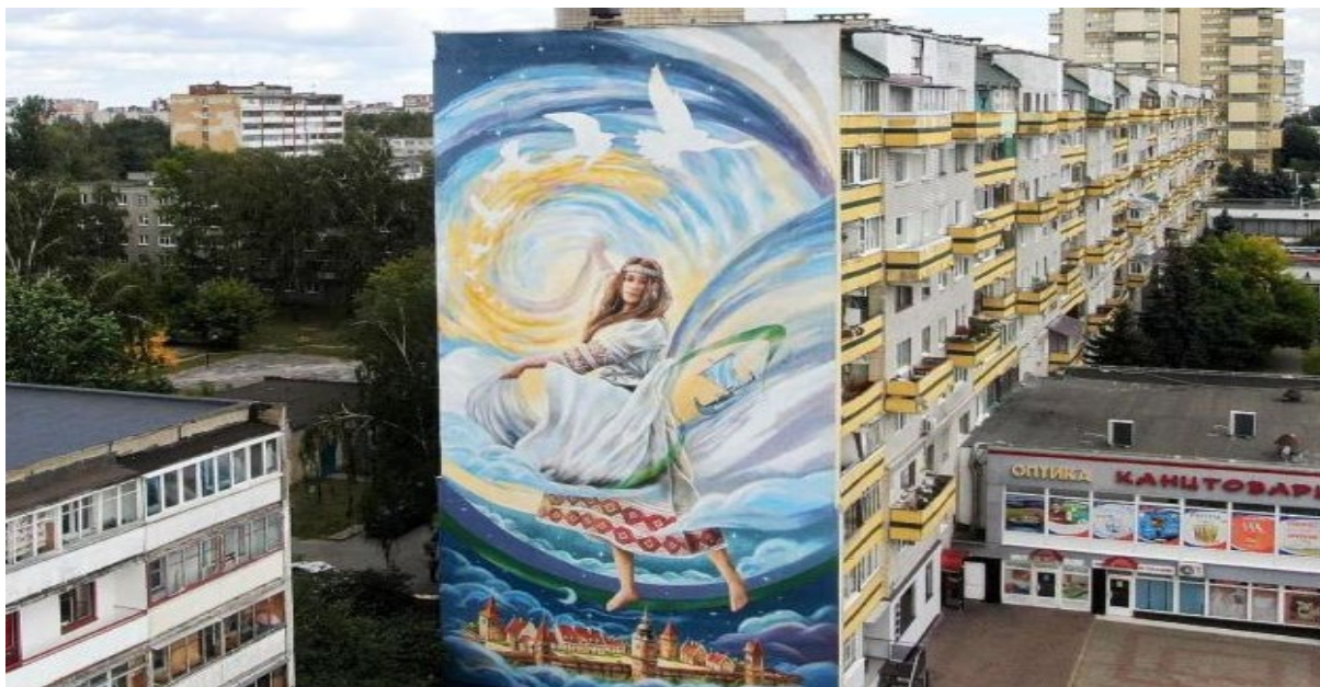
Рисунок 7 – Мурал “Зямля пад белымі крыламі” [10]