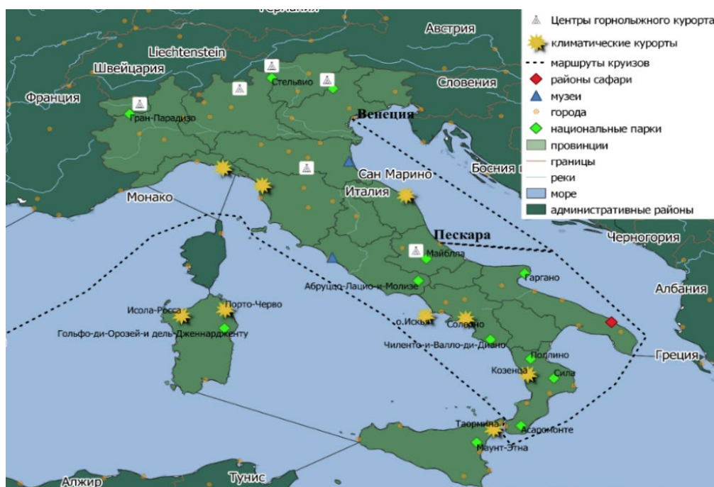
Рисунок 2 – Особенности и размещение туристской индустрии Италии (составлено автором)

Протяженность береговой линии Италии – 7455 км. Если добавить острова, то картина пляжной Италии становится необъятной. Ни одно государство, находящееся в бассейне Средиземноморья, не может сравниться с таким разнообразием морского ландшафта, климата, моря, местных традиций и обычаев. За несколько десятилетий Италия открылась для массового пляжного туризма. Многие провинции и коммуны ежегодно борются за право получить Голубой флаг – европейское признание качества и экологии моря. Приморские районы Италии, особенно Лигурийская Ривьера, остров Сицилия, Сардиния, отличаются особой легкостью климата. Здесь разница между средней температурой самого холодного месяца (января) и самого жаркого (июля) примерно 15°C. Поэтому по побережью Италии, цепочкой тянутся известные климатические курорты. В северной части Италии расположены ключевые туристские направления: Рим, Милан, Венеция, Флоренция [2].