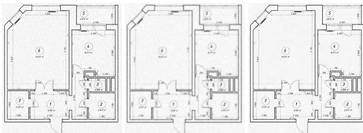
а) входное изображение б) изображение после фильтрации Гаусса ( \sigma = 1,5 ) в) изображение после фильтрации ROF