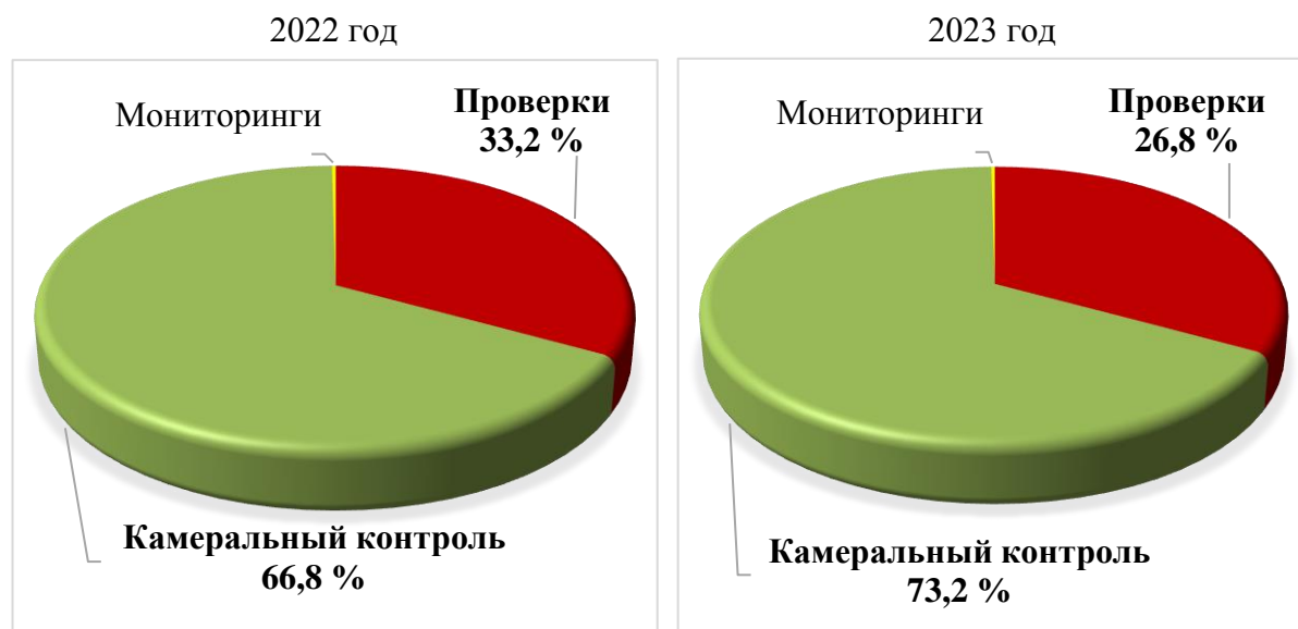
Рисунок 1 – Структура поступлений в бюджет в разрезе контрольных мероприятий инспекций МНС Гомельской области в 2022–2023 гг., в процентах

оформления всех предусмотренных реквизитов налоговой декларации (расчета), правильность арифметического подсчета итоговых сумм налогов, иных платежей, подлежащих уплате в бюджет. Последующий камеральный контроль осуществляется налоговым органом на предмет соответствия данных налоговых деклараций с данными иных информационных ресурсов, например, АИС «Учет счетов-фактур», таможенных органов, сведений из заявлений о ввозе товаров и уплате косвенных налогов, государственного реестра плательщиков, иных источников.