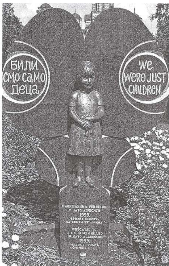
Рисунок 4 — Памятник детям, погибшим при бомбардировках НАТО, Белград.

НАТО официально продекларировало, что его идеологический базис, в том числе отношение к праву на жизнь жителей других стран, аналогичен идеологическому базису нацистской Германии.