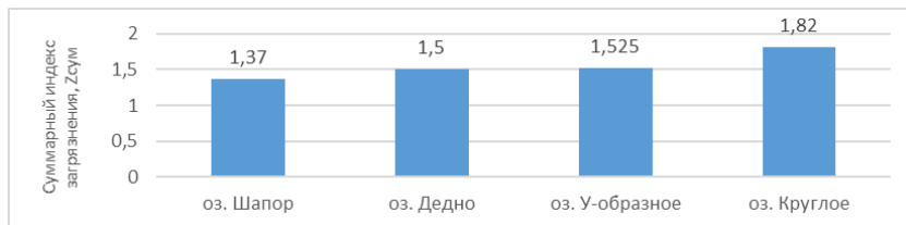
Рисунок 2. Показатель суммарного загрязнения мягких тканей моллюсков тяжелыми металлами ( Z_{\text{сум}} ) водоемов г. Гомеля и прилегающих территорий

использовать показатель суммарного загрязнения водоема.