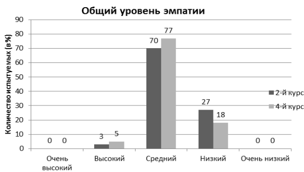
Рисунок 1. – Количественные показатели общего уровня эмпатии у студентов 2-го и 4-го курсов (в %).

На основании анализа полученных результатов были выделены три группы респондентов с высоким, средним и низким уровнями эмпатии. Эмпирические данные по общему уровню эмпатии у студентов 2-го и 4-го курсов представлены на рисунке 1.