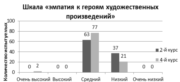
Рисунок 6. – Количественные показатели по шкале «эмпатия к героям художественных произведений» у студентов 2-го и 4-го курсов (в %).

На рисунке 6 представлены результаты исследования по шкале «эмпатия к героям художественных произведений».