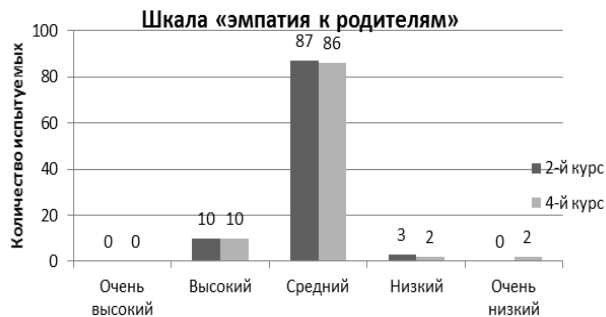
Рисунок 2. – Количественные показатели по шкале «эмпатия к родителям» у студентов 2-го и 4-го курсов (в %).

уровень – у 2 % студентов 4-го курса. Статистически значимых различий по шкале «эмпатия к родителям» у студентов 2-го и 4-го курсов не обнаружено.