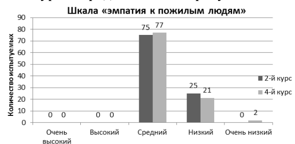
Рисунок 4. – Количественные показатели по шкале «эмпатия к пожилым людям» у студентов 2-го и 4-го курсов (в %).

Результаты исследования по шкале «эмпатия к пожилым людям» у студентов 2-го и 4-го курсов представлены на рисунке 4.