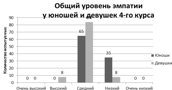
Рисунок 9. – Количественные показатели общего уровня эмпатии у юношей и девушек 4-го курса (в %).

На рисунке 9 представлены результаты исследования общего уровня эмпатии у юношей и девушек 4-го курса.