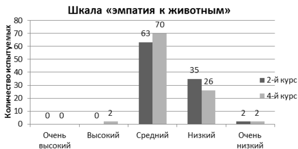
Рисунок 3. – Количественные показатели по шкале «эмпатия к животным» у студентов 2-го и 4-го курсов (в %).

Эмпирические данные, полученные по шкале «эмпатия к животным» у студентов 2-го и 4-го курсов, представлены на рис. 3.