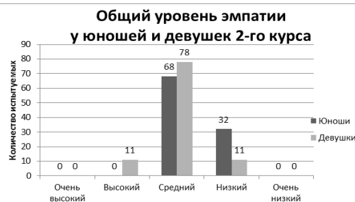
Рисунок 8. – Количественные показатели общего уровня эмпатии у юношей и девушек 2-го курса (в %).

Также нами была исследована эмпатия у юношей и девушек обоих курсов. Эмпирические данные общего уровня эмпатии у юношей и девушек 2-го курса представлены на рисунке 8.