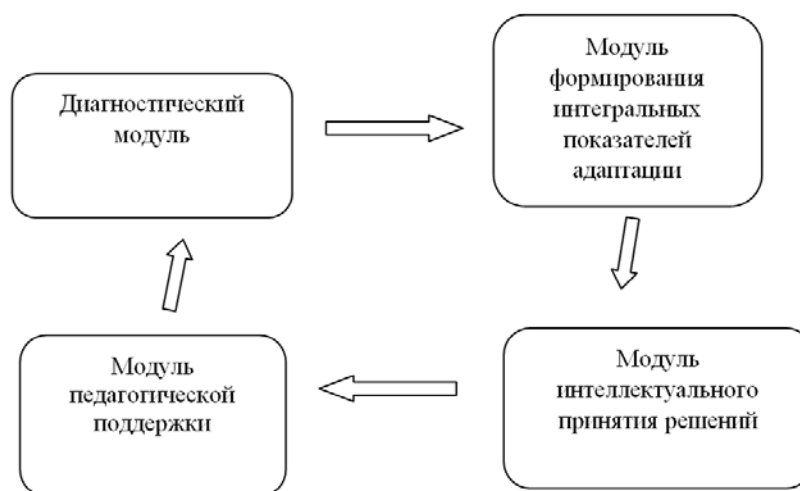
Рисунок 2 – Модель функционального обеспечения управления адаптацией иностранных студентов

Функциональное обеспечение управления адаптацией иностранных студентов состоит из взаимосвязанных модулей (рисунок 2).