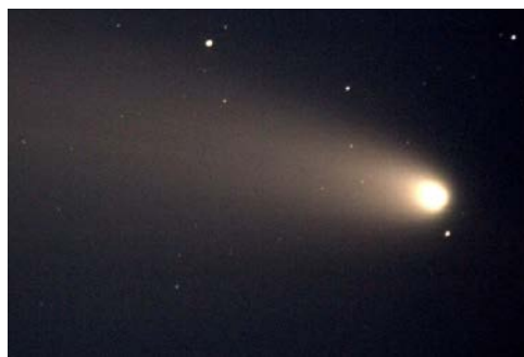
Рисунок 4 – Комета C/2023 A3, Гомель, Беларусь, 18.10.2024, 19 часов 20 минут, m = +3,5

Первичное изображение кометы на рисунке 3 получено фотоаппаратом Canon 750D с объективом Юпитер-37А 3,5/135. В случае рисунка 4 для первичного снимка использовался телескоп Sky-Watcher BK P2001 HEQ5. После чего была произведена обработка снимков с помощью DeepSkyStacker [9] – мощного программного инструмента, созданного для полного удовлетворения потребностей астрофотографов, которые хотят эффективно обрабатывать изображения глубокого космоса. Он имеет удобный интерфейс, адаптированный к многооконной структуре и обеспечивающий легкий доступ к изображениям в различных форматах файлов, включая изображения JPEG, BMP, PNG, TIFF и RAW.