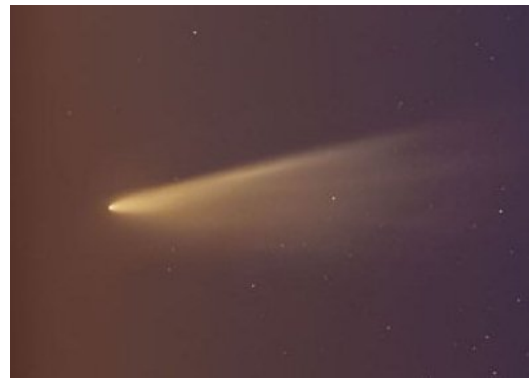
Рисунок 2 – Комета C/2023 A3, Аризона, США, 12.10.2024, максимально близка к Земле