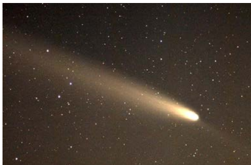
Рисунок 3 – Комета C/2023 A3, Гомель, Беларусь, 19.10.2024, 19 часов 50 минут, m = +4

После вышеупомянутых событий комета стала тускнеть, удаляясь от Земли и от Солнца. Удаление от Солнца в совокупности с появившейся чистотой вечернего неба позволили, наконец-то, увидеть всё ещё достаточно яркую комету в нашем регионе и непосредственно в городе Гомеле. Результаты наблюдений проиллюстрированы на рисунках 3 и 4.