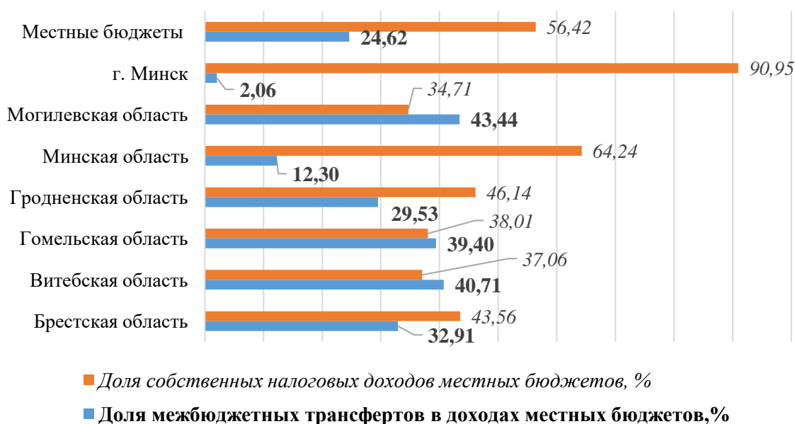
Рисунок 2 – Показатели структуры доходов местных бюджетов Республики Беларусь в 2022 году, в %

или 13,8 %, неналоговых доходов – 1 526,6 млн. руб. или 5,2 %, межбюджетных трансфертов – 7 218,1 млн. руб. или 24,6 %. Вместе с тем показатели структуры отдельных местных бюджетов по доходам, рассчитанные на основе фактических данных за 2022 год, не свидетельствуют о высоком уровне их самостоятельности (рисунок 2, рассчитано на основе [2]).