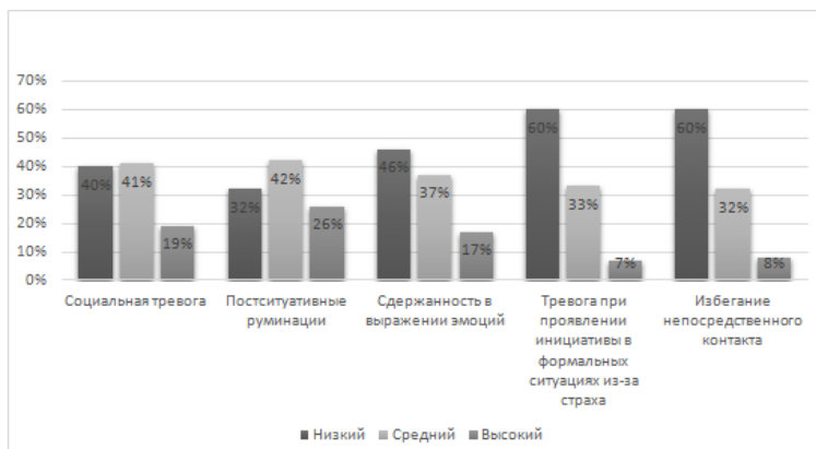
Рис. 2 Уровень социальной тревоги у студентов, проживающих дома

Процентное соотношение по шкале «Социальной тревоги» демонстрирует более частое проявление высокого уровня социальной тревоги у студентов, проживающих в общежитии. Для установления различий в проявлениях социальной тревожности у студентов, проживающих в общежитии и дома, был использован t-критерий Стьюдента (с предварительной проверкой выборки на нормальность распределения). Результаты представлены в Таблице 1.