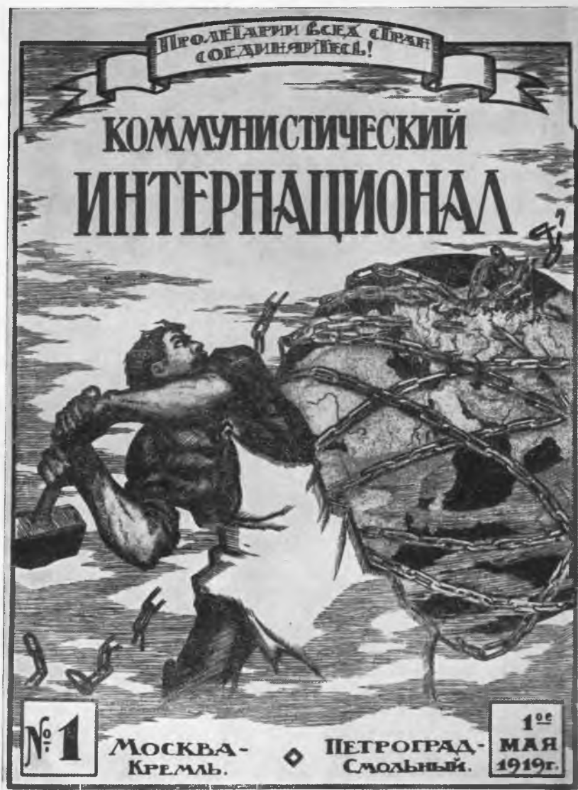
Обложка первого номера журнала «Коммунистический Интернационал»