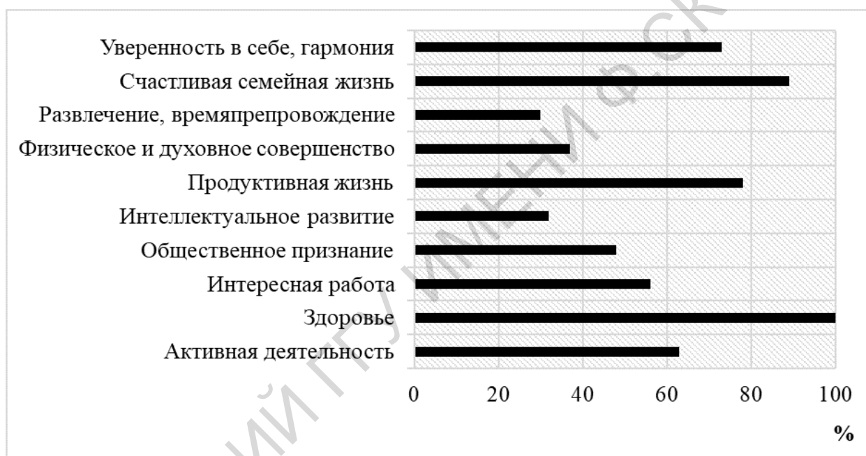
Рис. 1. Приоритетное распределение терминальных ценностей женщинами зрелого возраста (n=86)

Характерно, что у женщин первого зрелого возраста (21-35 лет) первичным источником к формированию побудительной мотивации к занятиям шейпингом является группа эстетических мотивов, направленных на красоту телосложения и привлекательность общего внешнего вида. Во второй возрастной группе женщин (36-55 лет) отмечается оздоровительная направленность занятий шейпингом – укрепление здоровья с избавлением от ряда заболеваний, связанных с инволюционными возрастными изменениями.