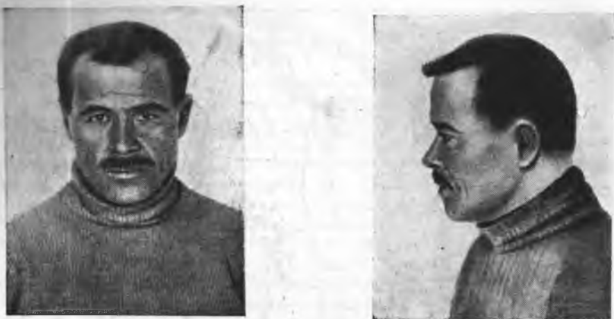
Рис. 4, 4а. Тип верхнеязывинского коми пермяка (epi face и в профиль)

важный тип иногда называют даже «урало-алтайским». Смягченный его вариант, более близкий к европеоидам, преобладающий среди мари и чувашей (вероятно, также среди косланских коми и колвинских немцев). В. В. Бунак обозначает как «субаральский» или «средне-волжский» 4 .