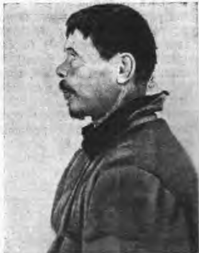
Рис. 2, 2а. Тип зюдинского коми пермяка (en face и в профиль)

Далее на запад тип, аналогичный удорскому, но еще более высокорослый и светлый, преобладает в различных странах Северной Европы, особенно на Скандинавском полуострове. В специальной антропологической литературе этот тип обычно называется североевропейским или просто северным 2 .