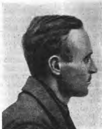
Рис. 1, 1а. Тип удорского коми (en face и в профиль)