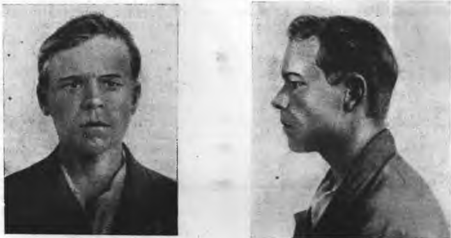
Рис. 3, За. Тип коми с верхней Мезени (epi face и в профиль)

гельской, Вологодской, Ярославской, Калининской и Ленинградской областей, среди белоруссов, вепсов, южных карел, ленинградских финнов, эстов, латышей и литовцев. Отмечен этот тип также на территории Польши и в восточных провинциях Германии. На южных и западных рубежах своего ареала балтийский комплекс постепенно сменяется близкими формами — тоже короткоголовыми, но несколько более