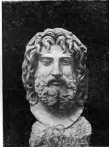
Рис. 13. Голова статуи Гадеса из Кирены

В начале 30-х годов раскапывался стоящий к северу от храма Аполлона Артемизий. Культ Артемиды в Кирене засвидетельствован с глубокой древности, и святилище ее трижды перестраивалось, подобно другим древним культовым сооружениям. Древнейший Артемизий представлял собой закрытое и в плане близкое к квадрату помещение (8,4 м × 8,65 м). Оно имело две поддерживающие перекрытие и как бы разделяющие целлу колонны. Широкий вход также посередине разделен колонной. Это