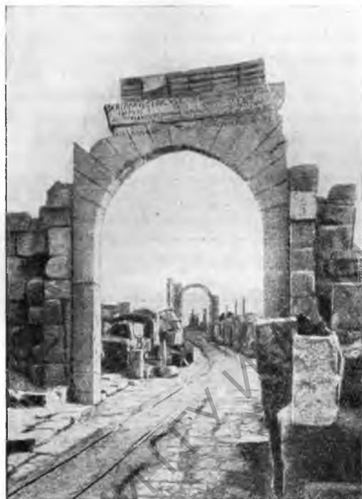
Рис. 16. Реставрированная арка Тиберия в Лептисе

были портреты представителей юлиево-клавдиевой императорской фамилии. Последние из известных нам археологических работ состоят в окончании раскопки «Виллы Нила» — большого жилого комплекса с термами. В помещении тепидария открыты мозаики с изображением аллегорической процессии божества Нила, верхом на гиппопотаме, ведомом двенадцатью детьми (вместо шестнадцати — в известной группе Нила) и двумя нимфами, а также [морского] пейзажа с лодками и рыбаками; третья мозаика изо-