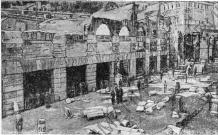
Рис. 2. Таверны на форуме Цезаря в Риме

Р и м и Л а ц и й. Наиболее интересные открытия, сделанные в Риме с 1930 по 1935 год, сосредоточены на территории императорских форумов. Снесение ряда поздних построек на форуме Ю. Цезаря привело к обнаружению храма Venus genetricis , линии лавок и таверн (рис. 2), а также расположенной по соседству базилики Ульпия. Подобного же рода расчистки имели место на форуме Нервы (рис. 3) и Траяна. Помимо архитектурных остатков, добыто известное количество строительных и посвячительных надписей, скульптур (среди которых имеются очень хорошие портреты) (рис. 4) и бытового материала.