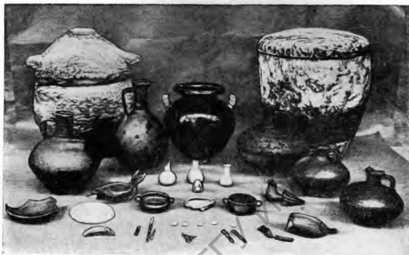
Рис. 7. Урны, керамика и стеклянные сосуды из могил в Экви

Тури н. Весной 1933 г., при рытье фундаментов для здания муниципалитета (на восточной стороне Виа делья Консолята), была обнаружена линия древней оборонительной стены, датирующейся временем Цезаря или Августа и представляющей собой прекрасный образец римской военно-инженерной техники. В марте 1937 г. новый участок стены был найден на Пьяцца Каstellо, в то время как на второй трассе Виа Романа, в начале мая, был открыт древний водопроводный канал, подававший в город воду из реки По (АЖА, vol. XLI, 1937, стр. 486 сл.).