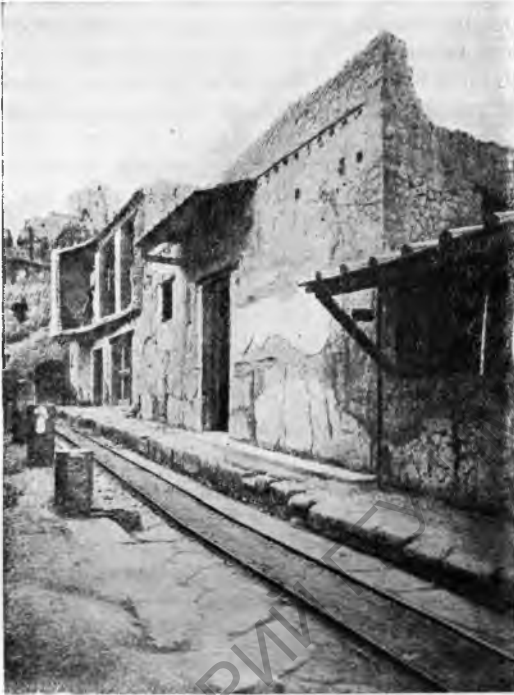
Рис. 9. Двухэтажный жилой дом и таверна в Геркулануме

По м п е и. В конце 20-х и в начале 30-х годов в Помпеях было расчищено несколько зданий с прекрасными мозаиками, ставшими уже знаменитыми. Достаточно напомнить