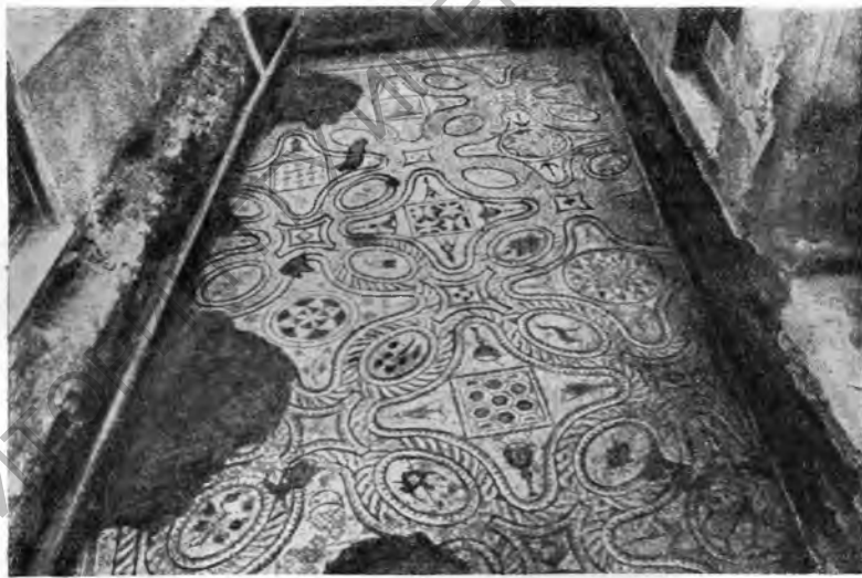
Рис. 6. Часть мозаичного пола в Лопано

Лопано (бл. Савоны). Обнаружены (в 1937 г.) остатки здания с прекрасным мозаичным полом (12 м × 5 м), с белыми и черными тессерами, относящимися к позднеимператорскому времени, по мнению итальянских археологов, или, как думает Van Buren,