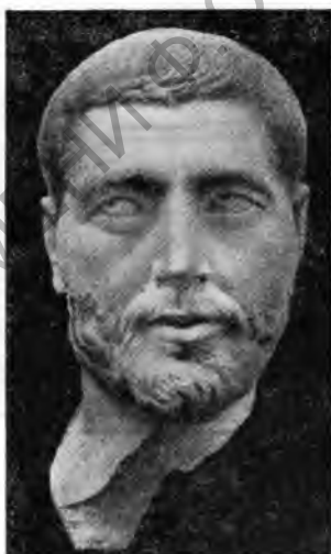
Рис. 4. Портретная скульптура из Рима

шахт через водоносные почвенные слои, а именно к замораживанию грунта. Результаты, полученные в мае 1937 г., оправдали это дорогостоящее предприятие. Из-под фундаментов дворца удалось извлечь большой мраморный блок, украшенный с одной стороны гирляндой, а с другой—прекрасным барельефом, с изображением императора и фламинов, совершающих жертвоприношение. Эти последние представлены в своих характерных головных уборах, заканчивающихся арех'ом. Трактовка индивидуальных черт изображенных персонажей, равно как и их одежды, весьма реалистична и, несомненно, портретна (RAG, t. X, 1937, стр. 122 сл.—F. S. m o n t; AJA, 1937, № 3, стр. 486 сл.—A. W. v a n B u r e n).