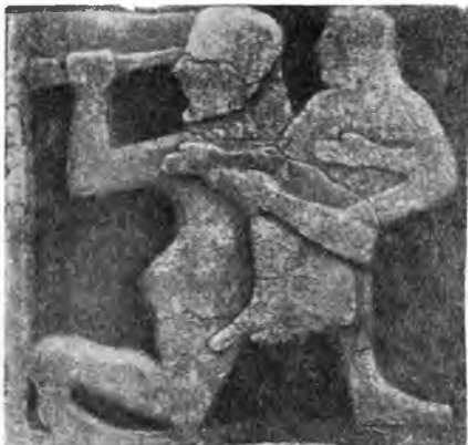
Рис. 10. Метоп из раскопок храма Геры близ Пестума

Найдены также фрагменты триглифов и метопов. Один из последних удалось собрать целиком; к сожалению, он очень пострадал еще в древности, будучи использован в качестве базы для стелы. На нем сохранились остатки изображения Геракла с дельфийским треножником. Все архитектурные фрагменты—из известняка, как и в более древних храмах Пестума. Раскопки целлы, сохранившей блоки поста-мента, на котором покоилась статуя богини, обнаружили следы более древнего святилища, существовавшего некогда на этом месте. Среди кусков пережеванной глины и угля найдены обломки нескольких архаических статуэток и керамики первой половины VI в. до н. э. В 15 м к северу от храма открыта еще одна