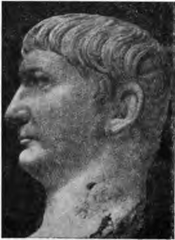
Рис. 5. Голова статуи императора Траяна из Остии

В 1934 г. были найдены три новых фрагмента аста urbis . Они сообщают о различных событиях за 116—153 гг. н. э., примыкая, таким образом, почти непосредственно к фрагменту 1932 г. В первом из них содержится послание Траяна к сенату с сообщением о победах, одержанных в парфянской войне (116 г.). Это сообщение было получено в Риме 23 марта. В ответ на него сенат отдал распоряжение об устройстве празднеств. В начале 145 г. состоялось бракосочетание Аппии Фаустины с Марком Аврелием. В конце июня того же года был дан бой быков в цирке Фламиния. В октябре состоялся судебный процесс Корнелия Присциана (легата одной из испанских провинций) за злоупотребление властью. В 146 г. умер Эруций Кларус, префект г. Рима, который незадолго до того был избран консулом. Под 151 годом сообщается о высылке из Рима двух или многих лиц по неизвестным причинам. В 152 г. был отремонтирован pons Cestius . 31 мая того же года отстроена базилика в Остии, которую соорудил некий М. Юлий Север, может быть, идентичный с известным consul suffectus того же имени. Весьма также вероятно, что упомянутая базилика идентична с большой постройкой, открытой на левой стороне форума и датирующейся, по археологическим данным, серединой II столетия н. э.