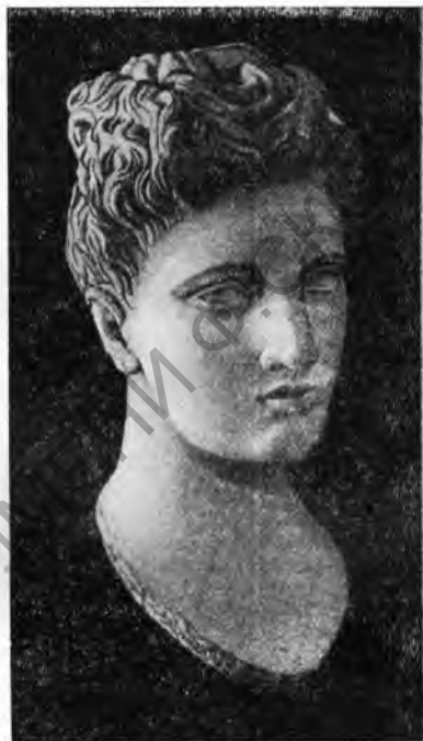
Рис. 1. Женская голова из Бутринто