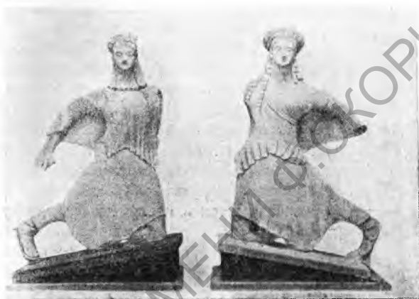
Рис. 12. Архаические терракотовые акротерии из Тарента

треблении одновременно. Одна из погребальных камер выстроена с особым искусством и имеет дорические колонны, поддерживающие перекрытие. В ней хоронили на протяжении трех столетий. В ряде могил обнаружена протокоринфская и коринфская керамика. Встречается также ионийская и аттическая посуда. Наиболее интересные из керамических находок—это две чернофигурные пелики и большой краснофигурный кратер. Первая из упомянутых ваз имеет изображение бородатого воина в архаическом шлеме, с круглым щитом, и девушки в тунике и гиматии, протягивающей ему фиалу. За ней бородатая фигура с венком в руке. На втором сосуде сцена преследования Фетиды Пелеем. На тыльных сторонах обеих vaz обычные сцены эфэбов. Кратер с одной стороны украшен изображением отправляющегося в дорогу воина и с другой стороны — Эос, похищающий Кефала. Образцом типичной тарентинской продукции раннеэллинистической эпохи может служить двуручный сосуд с фигурами эротов, исполненных накладным рельефом со следами белой и серебряной раскраски,— подражание торевтике, характерное для этого времени. Сверх керамики найдено много терракотовых статуэток в могилах, а также в колодце, который, вероятно, являлся фависсой какого-либо близстоящего храма. Он содержал фрагменты статуэток, датирующихся от V до III в. до н. э.