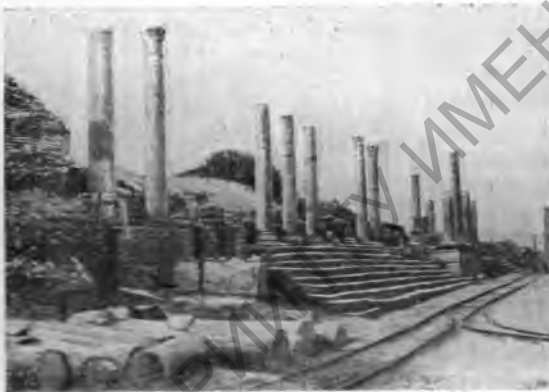
Рис. 15. Халкидик в Лептисе, с восстановленными колоннами

Лептис Магна. В конце 20-х годов расчищено большое количество развалин зданий, расположенных по обе стороны дороги, проходящей через Лептис (Декуманус). Дорога пересекает город, достигая храма Януса квадрифроне, эпохи Септимия Севера и имея на поворотах