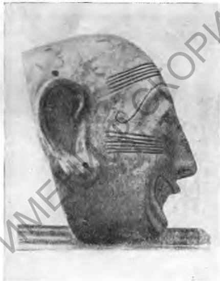
Рис. 17 Погребальная терракотовая маска из Карфагена

Некоторые из них могут быть датированы III в. н. э. Интересна также мозаика, происходящая из другого дома этого же района, с изображением бытовых сцен и архитектурных пейзажей большой африканской латифундии римского времени. В центре изображена вилла с хозяйственными постройками, а по сторонам — сцены сбора плодов, пастбища и т. д., а также и сам владелец виллы на охоте. Мозаика относится к IV столетию н. э.