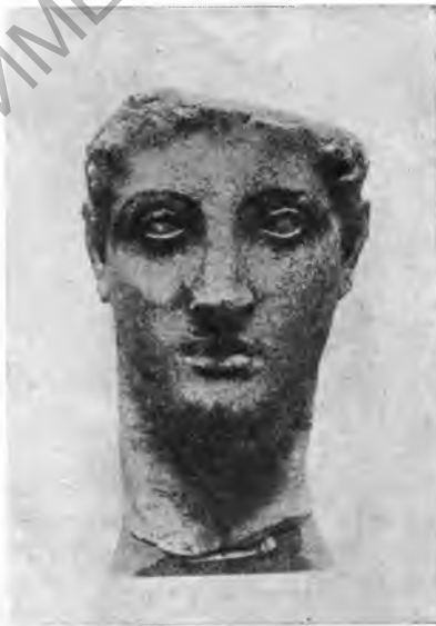
Рис. 14. Голова статуи Птолемея Филадельфа из Кирены