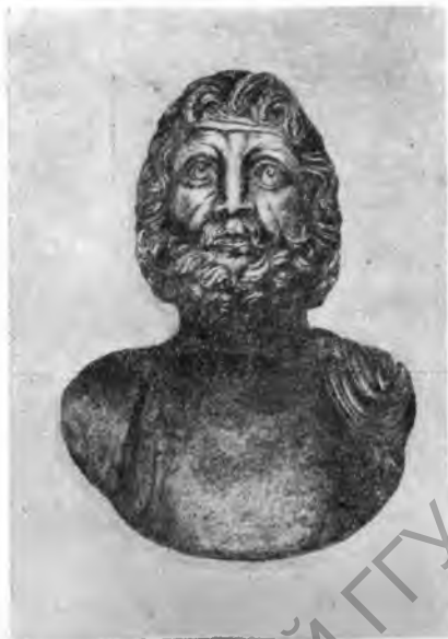
Рис. 8. Серебряный бюст Юпитера в музее Аосты

У Лаго ди Лердо (Трент, к востоку от сев. части озера Гарда) благодаря сильному понижению уровня воды обнажились значительные остатки свайных построек (палафитт) эпохи поздней бронзы (конец II тысячелетия до н. э.). При их исследовании было подсчитано от 15 до 20 тысяч свай, поддерживавших