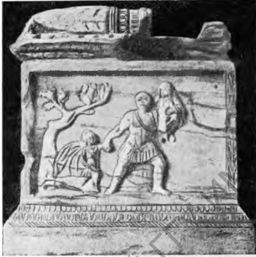
Рис. 18. Жертовник из Карфагена (на рельефе Эней, с Анхизом и Асканием, покидающий Трою)

У т и к а. Близ Утики, в Бир-Дербале найдено пуническое святилище римского времени, среди развалин жилища римского типа, с целлой, открывающейся на дворик, обращенный к востоку. В двух больших нишах помещались культовые терракотовые статуэтки, одна из которых изображала богиню с львиной головой ( genius terrae africae ). Другие—это фигурки обнаженных женщин и мужчин в туниках. Некоторые статуэтки позолочены. Здесь же найдены монеты времени Веспасиана. На расстоянии 20 м находилось небольшое поле стел, посвященных Сатурну (Баалу) и украшенных символами богини Танит: полумесяцами, цветами, пальмовыми ветвями и т. д. В самой