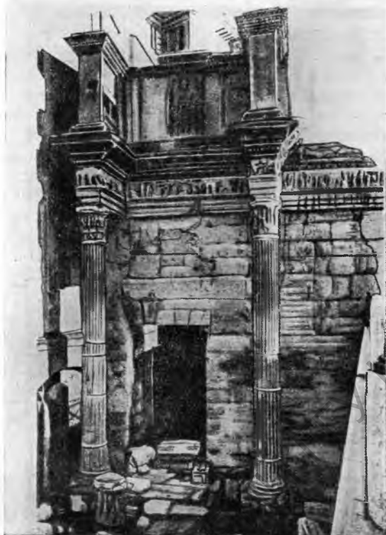
Рис. 3. Форум Нервы в Риме. Часть стены с реставрированными колоннами

Раскопки, предпринятые для их извлечения в 1903 г., окончились неудачей из-за обилия грунтовых вод. Кроме того, был очень велик риск обвала или оседания дворца Фиано. Поэтому теперь решено было прибегнуть к способу, применяющемуся при прокладке