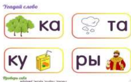
Рисунок 1 – Ребусы

К примеру, на занятиях с первым курсом нами были предложены следующие ребусы для изучения новых слов по тексту (рисунок 1).