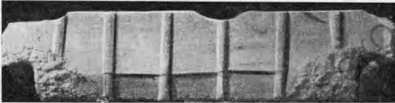
Рис. 10. Мраморная крышка саркофага.

Плиты служили крышками саркофагов. На нижних углах той и другой плиты были акротерии, срубленные при вторичном использовании плит: на углах видна грубо обработанная поверхность—следы оснований акротериев. На оборотной стороне плит—