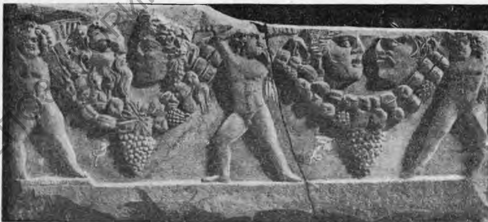
Рис. 16. Стенка саркофага с вакхическими масками.

№ 15. Большая плита с изображением вакхических масок и Эротов (рис. 16). Размеры плиты: длина—2,35 м, высота—1,05 м, толщина—