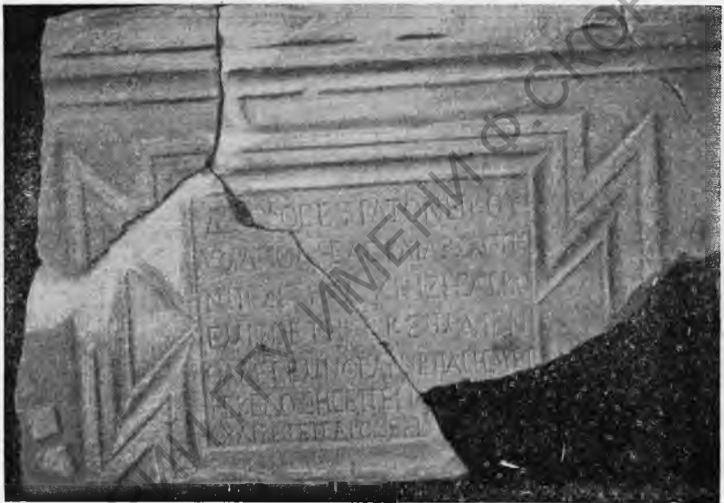
Рис. 2. Мраморная плита с надписью.

Техника обработки плит одна и та же. Лицевая сторона их обтесана мелкой зубаткой, но не отшлифована; начисто сделаны и отшлифованы только изображения. Обрат-