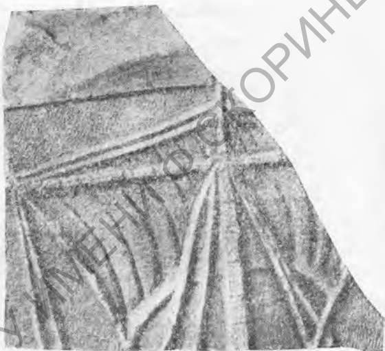
Рис. 5. Обломок плиты с изображением корабля—мачта с парусами.

№ 4. Фрагмент с изображением корабля. Размеры фрагмента: длина—0,53 м, высота—0,50 м, толщина—0,13 м. От корабля сохранилась только верхняя его часть—мачта с развернутым и надутым от ветра парусом (рис. 5). Изображение корабля, вероятно, было связано с должностным положением умершего, являлось его атрибутом: не был ли покойный навархом, командиром херсонесской эскадры?