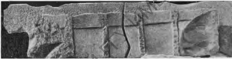
Рис. 11. Мраморная крышка саркофага.

многоступенчатый профиль и изображения крестов в середине (рис. 11, на переднем плане): плиты были употреблены повторно в качестве карнизов над дверями в базилике VI в. При новом назначении плит акротерии оказались лишними, поэтому они были срублены, стесаны также калиптеры на одной плите и часть поверхности; кроме того, на концах плит сделаны были выемки для того, чтобы карнизы можно было ввести в толщу стен над дверями. Одна из плит разбита на две части, что произошло, вероятно, при падении ее во время гибели базилики.