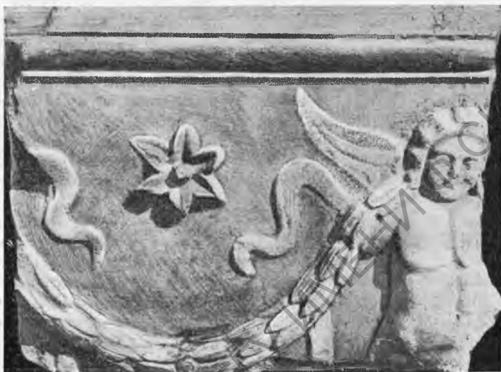
Рис. 14. Фрагмент стенки саркофага.

№ 13. Сильно фрагментированная плита, высотой 0,70 м, длиной 0,85 м, толщиной 0,16 м; боковые и нижний края ее обрублены (рис. 14).