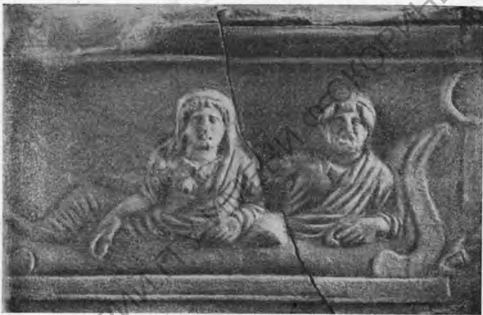
Рис. 7. Муж и жена на ложе. Деталь передней стенки саркофага.

Изображения на плите выполнены в трех планах; самый мелкий масштаб—центральная группа на ложе; в наибольшем масштабе даны маски Медузы; среднее поло-