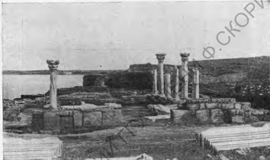
Рис. 1. Базилика VI в., открыта раскопками в 1935 г. Вид с запада.

Под базиликой, на глубине 0,70 м от мраморного пола, открыт цементный пол, длина его—14,30 м, ширина—около 11 м. Пол находится под средним нефом, частью под северным нефом базилики. Возможно, что часть цементного пола уходит под южный неф, но раскопка в нем не производилась ради сохранения мозаичного пола базилики.