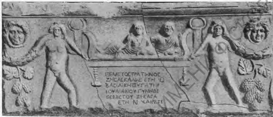
Рис. 6. Стенка саркофага с именами Фемиста и Василики.

Спинки ложа высокие, изогнутые; ножки под ним точеные, с чередующимися валиками и бороздками, под ножками прямоугольные подставки.