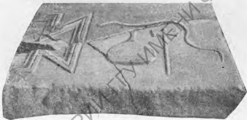
Рис. 3. Часть плиты с надписью и изображением атрибутов.

Количество лет умершего не указано; повидимому, надпись была вырезана еще при жизни Дельфа, после же его смерти забыли поставить его возраст, хотя место для этого было оставлено. Имя «Дельф» в надписях Херсонеса встретилось лишь однажды 1 , на амфорных клеймах оно известно 2 . Имя «Стратоник» в херсонесских надписях встречается (IosPE, 1 2 , 347, 691, II—I вв. до н. э.).