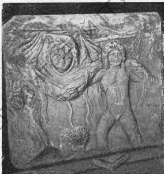
Рис. 13. Стенка саркофага.

На боковых краях плиты сохранились ленты, указывающие на то, что справа и слева на плите были изображения еще двух Эротов, в левом нижнем углу виден след сбитой базы, на которой стоял Эрот. Концы плиты обрублены при повторном ее использовании.