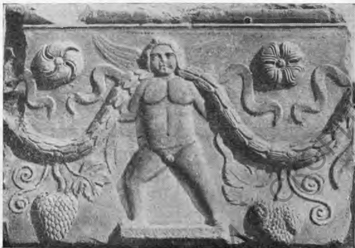
Рис. 12. Длинная стенка саркофага.

ленты, одна пара на уровне плеч, другая спускается ниже рук. В верхней части плиты над гирляндами помещены четырехлепестковые розетки различной формы: левая в виде «сегнерова колеса», правая—крестообразной формы.