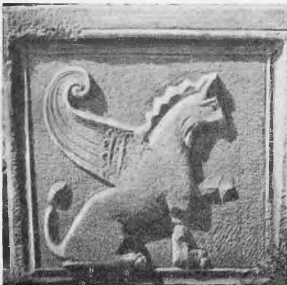
Рис. 15. Плита с изображением грифона.

Композиция фигуры грифона строго симметрична, при этом симметрия выдержана по всем линиям: по горизонталям вверх и вниз, по вертикалям и по диагоналям. Такое построение делает фигуру очень схематичной и лишенной выражения, к тому же и выполнение отличается сухостью и резкостью. Рельеф невысокий и плоский.