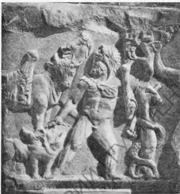
Рис. 17. Плита с изображением Геракла.

В центре плиты—фигура Геракла, идущего вправо, торс его обращен прямо, а голова повернута назад, влево. Голова героя покрыта львиной шкурой (мордой льва), лапы ее завязаны узлом на груди, конец шкуры свешивается с левой руки. В той же руке Геракл держит суковатую палицу, поднятую толстым концом вверх. Правой рукой он ведет за собой на цепи трехглавого Цербера. Слева от Геракла, над Цербером, на заднем плане—две фигуры быка. Один из них, задний, бежит вправо, высоко подняв голову и раскрыв пасть. Это—бешеный критский бык. Рядом с ним, несколько ниже,