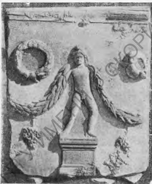
Рис. 8. Узкая стенка саркофага.

Гирлянды на этих плитах значительно тяжелее и массивнее, чем на плите № 5. Зато виноградные гроздья на плитах № 6—7 очень маленькие, а на плите № 5 они весьма крупные. Листья гирлянд также различны: на плите № 5 они очерчены резко и исполнены более сухо и схематично, чем на плитах № 6—7.