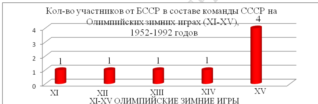
Рисунок 4 – Количество участников от БССР в составе команды СССР на Олимпийских зимних играх исторического периода 1952–1992 гг.

Количество участников от БССР в составе команды СССР на XI–XV Олимпийских зимних играх (ОЗИ) 1964–1992 гг. практически не меняется, на XI–XIV Олимпийских зимних играх по одному участнику (1), только на XV ОЗИ 4 участника (1964 г.), 1 (1968 г.), 1 (1984 г.), 1 (1988 г.), 4 (1992 г.), (рисунок 4). В период с 1964–1988 гг. зимние виды спорта на территории БССР практически не культивировались. Только на ОЗИ в Альбервиле БССР выставила 4 участника, это можно связать с окончанием СССР и созданием независимых республик, где спорт является хорошим политическим средством продвижения национальных интересов государства.