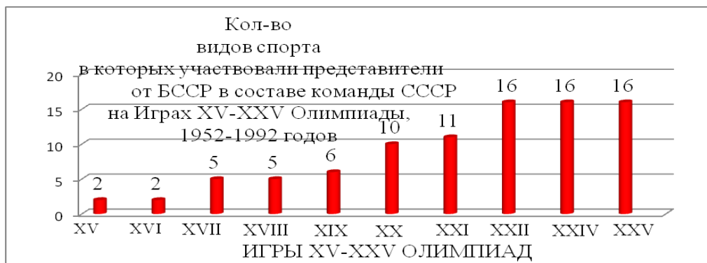
Рисунок 3 – Количество видов спорта представителей команды БССР в составе команды СССР на Играх XV–XXV Олимпиад исторического периода 1952–1992 гг. (в 1992 – объединенная команда СНГ)

Количество участников от БССР в составе команды СССР на XI–XV Олимпийских зимних играх (ОЗИ) 1964–1992 гг. практически не меняется, на XI–XIV Олимпийских зимних играх по одному участнику (1), только на XV ОЗИ 4 участника (1964 г.), 1 (1968 г.), 1 (1984 г.), 1 (1988 г.), 4 (1992 г.), (рисунок 4). В период с 1964–1988 гг. зимние виды спорта на территории БССР практически не культивировались. Только на ОЗИ в Альбервиле БССР выставила 4 участника, это можно связать с окончанием СССР и созданием независимых республик, где спорт является хорошим политическим средством продвижения национальных интересов государства.