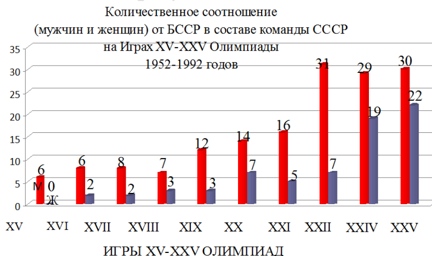
Рисунок 2 – Количественное соотношение (мужчин и женщин) команды БССР в составе команды СССР на Играх XV–XXV Олимпиад исторического периода 1952–1992 гг. (в 1992 – объединенная команда СНГ)

Количественное соотношение (мужчин и женщин) от БССР в составе команды СССР на Играх XV–XXV Олимпиады 1952–1992 гг. изменяется, имея положительную динамику от Игр к Играм, минимальное значение было 6 участников (Игры XV Олимпиады), максимальное – 52 участника (Игры XXV Олимпиады), наибольший скачек произошел между Играми XXI и XXII Олимпиады, это можно охарактеризовать Олимпиадой-80, прошедшей в Москве, в Играх XXIII Олимпиады 1984 г., прошедших в Лос-Анджелесе, участники СССР и БССР участия не принимали, на Играх XXIV и XXV Олимпиады количество участников только увеличивалось. Общие статистические сведения по количеству участников: 6 муж., 0 жен. (1952 г.), 6 муж., 2 жен. (1956 г.); 8 муж., 2 жен. (1960 г.); 7 муж., 3 жен. (1964 г.); 12 муж., 3 жен. (1968 г.); 14 муж., 7 жен. (1972 г.); 16 муж., 5 жен. (1976 г.); 31 муж., 7 жен. (1980 г.); 29 муж., 19 жен. (1988 г.); 30 муж., 22 жен. (1992 г.) (рисунок 2). Мужчин принимало участие больше, чем женщины. Территориальный фактор проведения Олимпийских игр существенным образом влияет на количество участников.