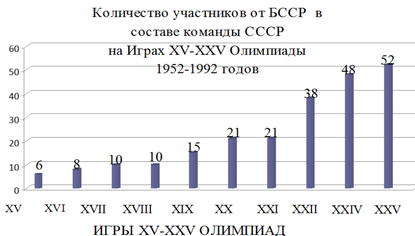
Рисунок 1 – Количество участников команды БССР в составе команды СССР на Играх Олимпиад исторического периода 1952–1992 гг. (в 1992 – объединенная команда СНГ)

Количественное соотношение (мужчин и женщин) от БССР в составе команды СССР на Играх XV–XXV Олимпиады 1952–1992 гг. изменяется, имея положительную динамику от Игр к Играм, минимальное значение было 6 участников (Игры XV Олимпиады), максимальное – 52 участника (Игры XXV Олимпиады), наибольший скачек произошел между Играми XXI и XXII Олимпиады, это можно охарактеризовать Олимпиадой-80, прошедшей в Москве, в Играх XXIII Олимпиады 1984 г., прошедших в Лос-Анджелесе, участники СССР и БССР участия не принимали, на Играх XXIV и XXV Олимпиады количество участников только увеличивалось. Общие статистические сведения по количеству участников: 6 муж., 0 жен. (1952 г.), 6 муж., 2 жен. (1956 г.); 8 муж., 2 жен. (1960 г.); 7 муж., 3 жен. (1964 г.); 12 муж., 3 жен. (1968 г.); 14 муж., 7 жен. (1972 г.); 16 муж., 5 жен. (1976 г.); 31 муж., 7 жен. (1980 г.); 29 муж., 19 жен. (1988 г.); 30 муж., 22 жен. (1992 г.) (рисунок 2). Мужчин принимало участие больше, чем женщины. Территориальный фактор проведения Олимпийских игр существенным образом влияет на количество участников.