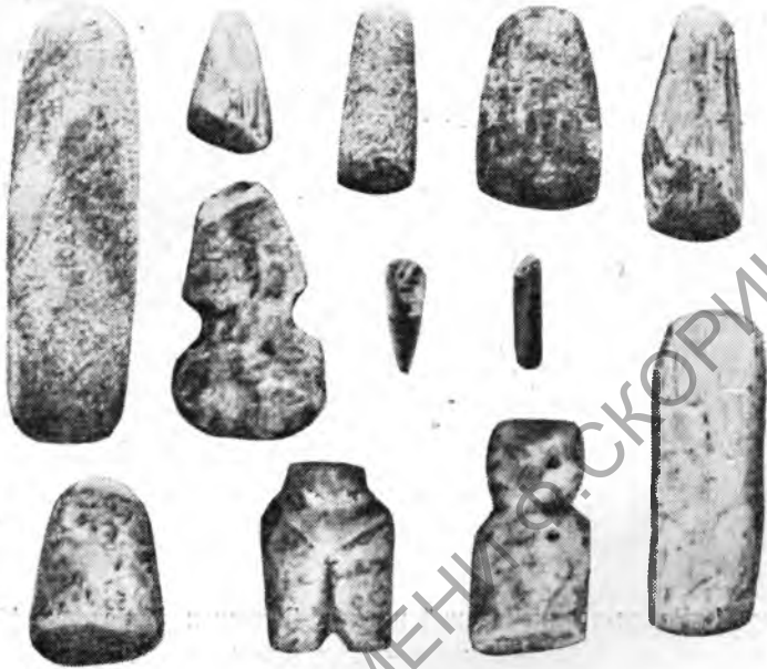
Рис. 2. Поздне-неолитический период. Западная Македония (Сербия). Образцы полированных орудий.

Из животных этому периоду были известны: волк, кабан, овцы, козы, лось; из растений—пшеница и чечевица.