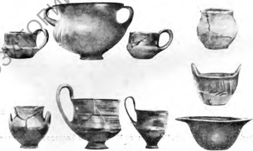
Рис. 7. Ранне-железный период. Центральная Македония. Керамика.

Позднележонзовая эпоха знает керамику различных форм с заменой прежнего прямолинейного орнамента орнаментом, заполняющим все тулово сосуда сочетаниями из треугольников, выпуклых спиралей и т. п.