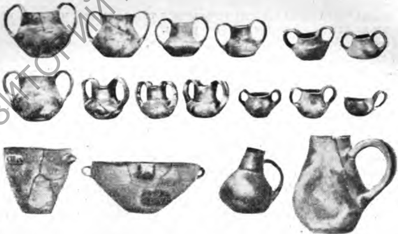
Рис. 3. Ранняя бронза. Западная Македония (Долина Черна). Керамика.

Археологические данные приводят автора к выводу, что культура от Халкэдики до западной Македонии в раннебронзовом периоде была единообразной. Большинство македонских форм и орнаментов имеет много параллелей в Трое и анатолийской