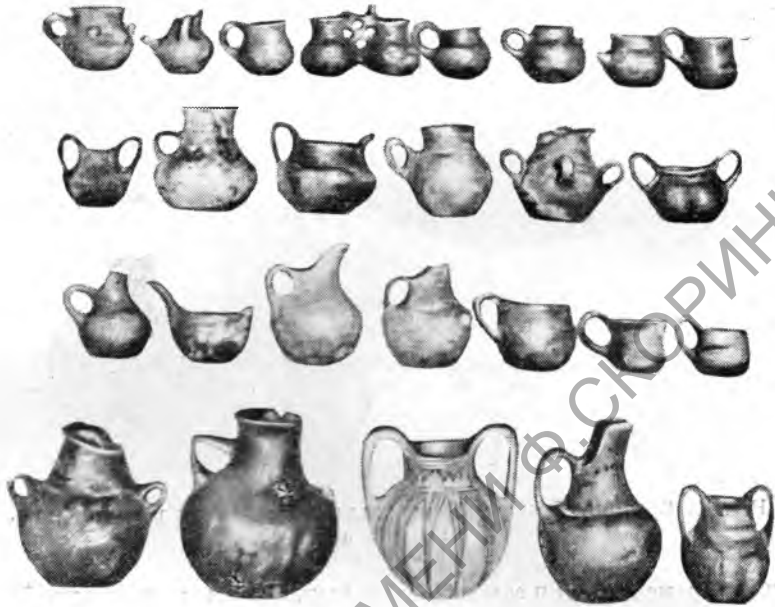
Рис. 6. Ранне-железный период. Западная Македония (Пателе): Керамика.

Из остатков животных были найдены кости оленя, лошади, волка, овцы, козы и свиньи (Центральная Македония и Халкидика), из растений—горох.