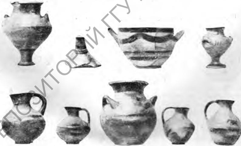
Рис. 5. Поздняя бронза. Центральная Македония и Халкидика. Керамика.

В противоположность единообразному характеру раннебронзовой культуры в Македонии, в среднебронзовую эпоху, при сохранении известного единообразия, наблюдаются уже местные различия, особенно в Халкидике.