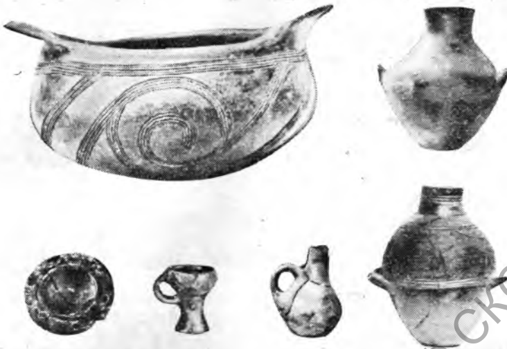
Рис. 4. Средняя бронза. Центральная Македония и Халкидика. Керамика.

В эпоху энеолита и бронзы, утверждает автор, мы имеем дело с проникновением в Македонию новой «расы», которая через Халкидику, занимая последовательно поселения, заселенные неолитическими аборигенами, продвигалась к центру Македонии,