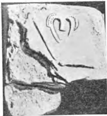
Рис. 3. Каменная плита с рельефным изображением человеческого лица. Троя I

Интересная находка обнаружена в 1937 г. в непосредственной близости от ворот оборонительной стены I города. Речь идет о профилированной плите из известняка