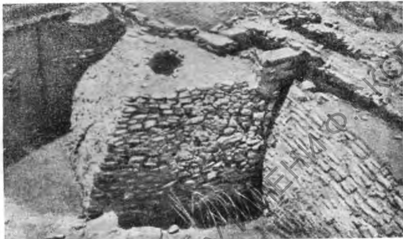
Рис. 2. Оборонительная стена и башня города I

Таков же в общих чертах и другой из новооткрытых домов Трои I, но он имеет несколько меньшие размеры, и остатки его дошли до нас в худшем состоянии.