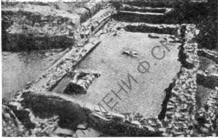
Рис. 1. Дом города Ia

Неподалеку от того места, где Шлиман обнаружил остатки древнейшего слоя Трои, в 1935—1936 гг. были открыты два жилых дома, относящиеся к периоду Ia. Дома имеют