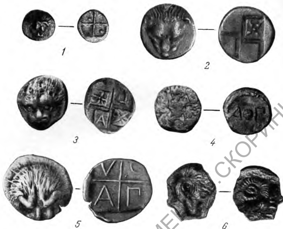
Монеты Пантикапея V в. до н. э. Из собрания ГИМ. Увеличено в 2 раза. 1, 2, 3, 5 и 6 — серебро; 4 — медь