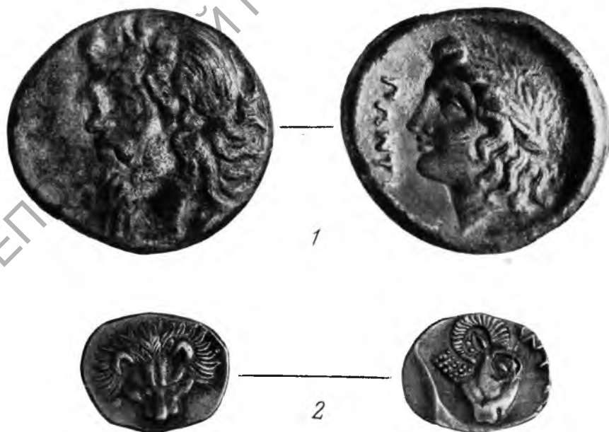
Серебряные монеты Пантикапея Из собрания ГИМ. Увеличено в 2 раза. 1 — начало IV в. до н. э., 2 — V в. до н. э.