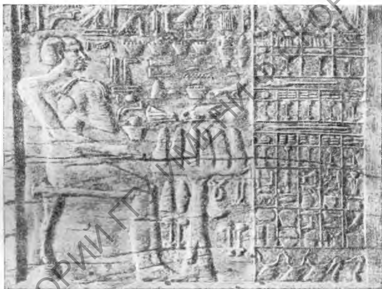
Рис. 5. Саккара. Деревянная стела из гробницы Ахет-хотепа

II династии и две солнечные барки из известняка, каждая до 45 м длиной. На стенах сооружений погребального комплекса фараона Унаса обнаружены многочисленные рельефы по известняку с изображением сцен доставки камня для пирамиды, сражений с бедуинами, лодок с пленными азиатами, жертвоприношений царю и богам, полевых работ всех сезонов, охоты, добычи камня и золота, а также изображение голодающего египтян (рис. 7). Все изображения сделаны в очень крупном масштабе (ChE, № 26). Под плитами пола крытой дороги был найден массивный шиферный саркофаг, который оказался неразграбленным. Правда, мумия и внутренний деревянный саркофаг пострадали от вод нильских разливов, но на костях скелета сохранились золотые украшения — браслет, пояс и на груди пластинка с именем «царского сына» Птахшпесеса (JLN от 26 февр. 1944 г.). Вблизи заупокойного храма найдено около 300 стел. Около той же пирамиды открыта огромная шахтная гробница, в стенах которой были обнаружены надписи времени персидской оккупации. Кроме того, в этой гробнице были найдены деревянные саркофаги писца храма Пта Канефера и его семьи. Первоначально эта гробница принадлежала начальнику гвардии фараона Априя Амон-Тепнахту.