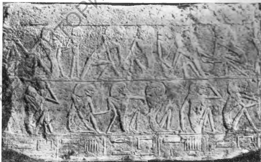
Рис. 7. Саккара. Рельеф внутренней стены крытой дороги, ведущей от пирамиды Унаса к его заупокойному храму в долине. Изображение голодающих