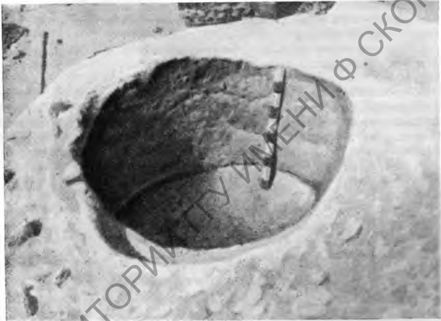
Рис. 2. Эль-Омари. Основание хазны

В этой же местности начаты раскопки колоссального некрополя раннединастического времени. Некрополь насчитывает около 5 тысяч могил. Скорченные 1 скелеты, найденные в этих могилах, были погребены частично без гробов, частично же в деревянных саркофагах. Среди могил некрополя открыт ряд больших гробниц, содержащих лапидарные надписи с именами фараонов: Ка 2 , Нармера и царей I династии Аха, Джера, Дена, Анджиба, Семерхета и Ка-Сена. Гробницы эти представляют собой монументальные сооружения из белого известняка (рис. 1) и снабжены богатым погребальным инвентарем; в большом числе найдены м е д н ы е сосуды; при входе в одну из