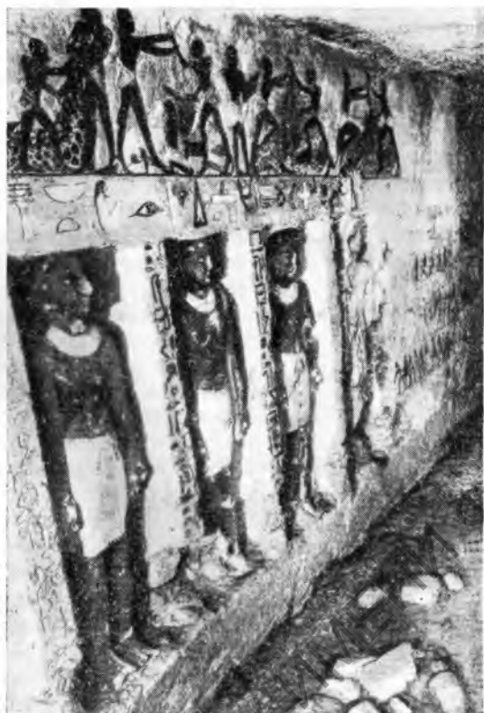
Рис. 6. Саккара. Статуи, высеченные в стенах гробницы Птах-Ирука