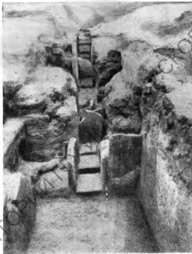
Рис. 1. Хелван. Гробница из белого известняка. Время I династии

М а а д и (около Каира). Здесь продолжались раскопки раннехалколитического поселения. Вскрыт новый участок поселения с круглыми и прямоугольными хижинами.