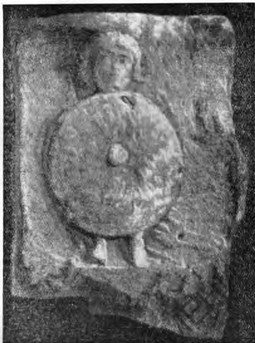
Рис. 1. Надгробная стела из Аквилеи

Cl(audia) p(ia) f(idelis), относится, повидимому, и недавно найденное надгробие с изображением легионера (рис. 1). Размер плиты — 0,40×0,46×0,20 м. Легионер вооружен круглым щитом и копьем. Щит закрывает фигуру почти полностью, ноги пере-