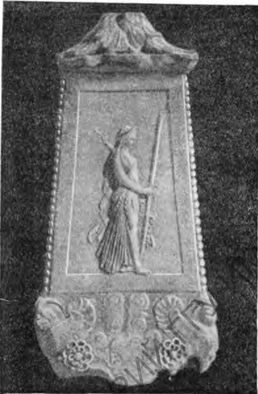
Рис. 6. Мраморная база новоаттического канделябра из Рима

Продолжалось исследование храма Беллоны. Установлено, что храм был восьми-колонным, базы и капители колонн сделаны из известкового туфа. Храм сооружен в республиканское время и полностью реконструирован в конце I в. н. э., может быть, после большого пожара 80 г. Здание ориентировано параллельно цирку Фламиния.