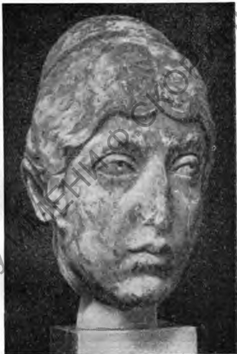
Рис. 5. Рим. Голова женщины. Время Антонинов

При реставрации средневековой церкви вблизи мавзолея Августа на М а р с о в о м п о л е в фундаменте был обнаружен ряд кладки из блоков желтого туфа, подобных тем, из которых состоит республиканская стена и другие здания IV—III вв. до н. э. Не исключена возможность, что эти блоки представляют собой остатки храма Марса,