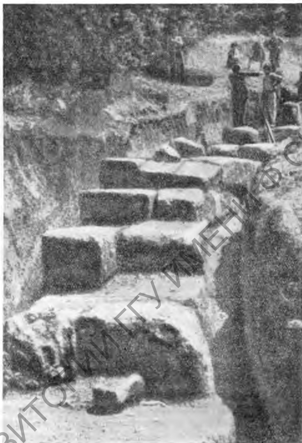
Рис. 3. Вольсинии. Этруская обводная стена V—IV вв. до н. э.

К о з а. В 1948 г. были проведены топографические исследования и частичные раскопки крепости и капитолия римской колонии 273 г. до н. э. Исследования выявили план, укрепления и главные здания города последних двух веков до н. э. Раскоп-