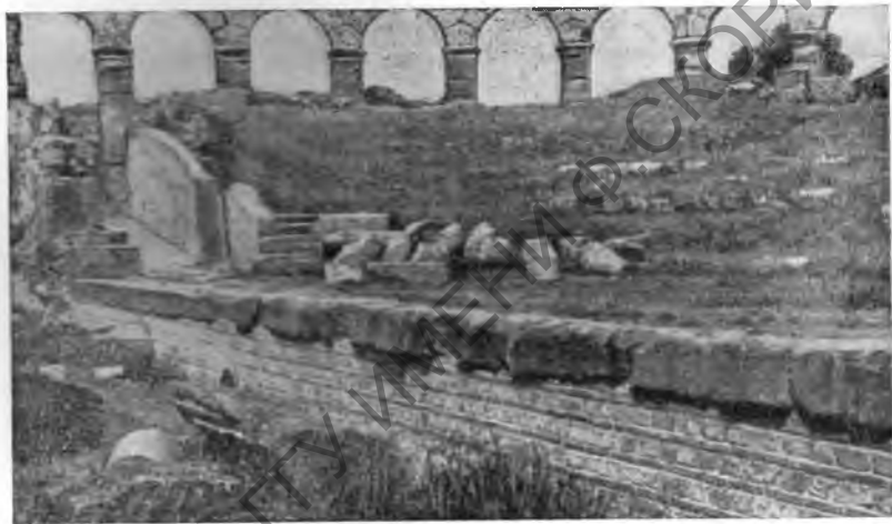
Рис. 4. Римский театр в Ференто

Р и м. Одним из интересных открытий последних лет было выявление языческих и христианских гробниц под базиликой св. Петра. Во время земляных работ, связанных с углублением ватиканских гротов под базиликой св. Петра, были найдены различные гробницы: простые земляные, каменные и саркофаги; одна из гробниц датируется надписью 414 г. Более ранний языческий некрополь состоит из серии мавзолеев или погребальных комнат, расположенных двумя параллельными рядами,