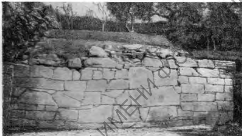
Рис. 2. Фезулы. Этрусская стена

Т а р к в и н и и. Раскопки 30-х гг. в Чивитта обнаружили часть оборонительной стены IV в. до н. э. и подиум большого храма. Работы 1939—1942 гг. выявили размеры этого храма: 77,15 на 35,55 м. Отдельные архитектурные части, как, например, антефиксы, позволяют датировать возведение храма IV или III в. до н. э. На территории города было открыто полукруглое основание здания, возле которого находилось большое количество вотивных терракот. Раскопки 1946—1947 гг. завершили выяснение