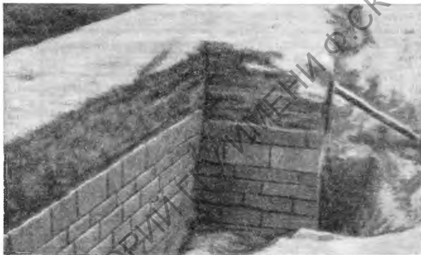
Рис. 9. Гела. Оборонительная стена V в. до н. э.

С и ц и л и я. В восточной части острова был открыт ряд палеолитических стоянок. Одна из них дала большое количество микролитических изделий. Возле Пьяцца