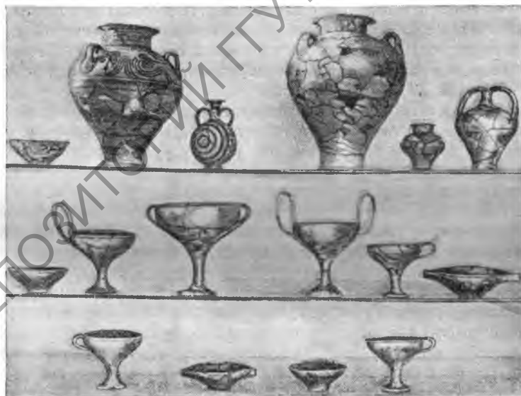
Рис. 2. Афины. Ареопаг. Керамика из могилы микенской эпохи

женными еще в 1939 г. (ВДИ, 1947, № 1, стр. 197 сл.), они составляют небольшой некрополь, который, судя по богатству погребального инвентаря и по близости к Акро-