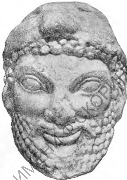
Рис. 4. Афины. Голова Геракла (архаическая эпоха)

Большой интерес вызывает открытие детских захоронений под полами жилых домов IV и III вв. до н. э.; большинство из них с трупосожжением. Повидимому, в этот период, вопреки обычаю хоронить мертвых за городской чертой, афиняне хоронили детей у себя дома. Может быть, против детской кремации городские власти и не возра-