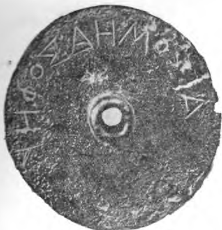
Рис. 3. Афины. Баллотировочный жетон из здания дикастерия

На северном, северо-западном и северо-восточном склонах Ареопага за последние годы обнаружен целый ряд могил с керамикой прото-геометрического и геометрического стиля: таково погребение в большой амфоре останков кремнированного воина,