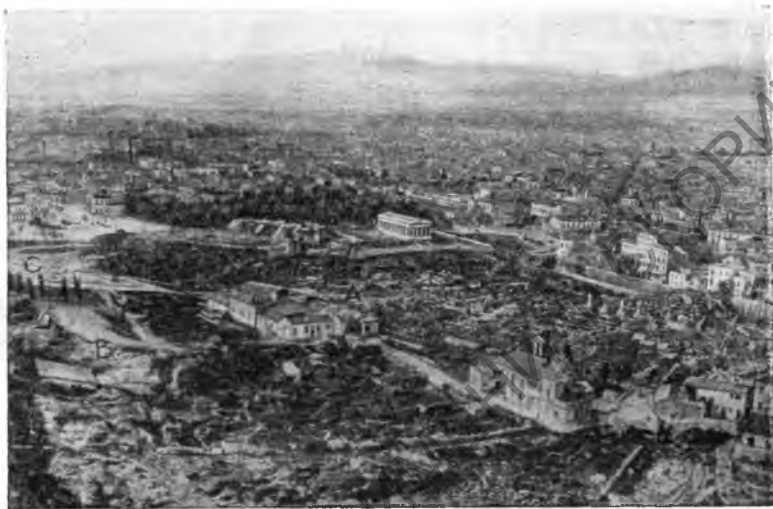
Рис. 5. Афины. Общий вид на раскопки агоры с Акрополя: А — западный конец Средней Стои; В — Минейский некрополь на северном склоне Ареопага; С — участок к западу от Ареопага

В результате работ 1946—1948 гг. удалось выяснить направление главных уличных магистралей и устройство системы сточных труб в районе агоры. Древняя дорога, выходящая из юго-западного угла агоры, шла на юг, огибая Ареопаг с запада. Ширина ее составляла от 3 до 4 м. Она была выложена несколькими напластованиями вымосток из плотно утрамбованного гравия. Вдоль средней оси улицы под вымосткой шел водосток с ответвлениями, забиравшими сточную воду из отдельных домов. В двух