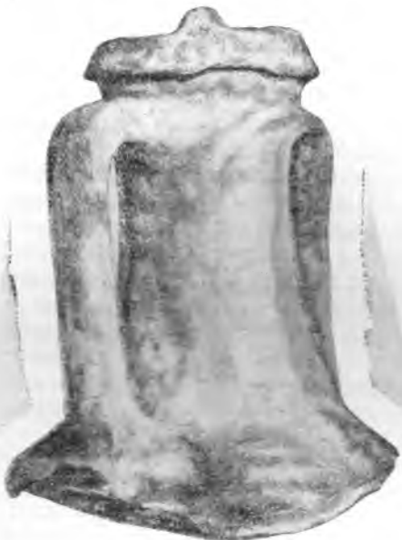
Рис. 6. Коринф. Горло амфоры с крышкой

К о р и н ф. Как и в Афинах, работы заключались главным образом в дополнительном изучении памятников, открытых в основном еще до войны. Главным объектом изучения и в Коринфе была агора. Шесть небольших храмов, окаймляющих западную сторону площади, определяются предположительно как храмы Тихе-Афродиты, Ге-