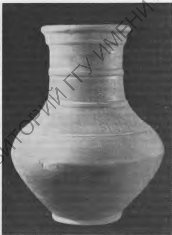
Рис. 1. Находки из Инкерманского (1948 г.) и Чернореченского (1950 г.) могильников: а—сероглиняный трехручный сосуд из Инкерманского могильника; б—сероглиняный острореберный кувшин из Чернореченского могильника