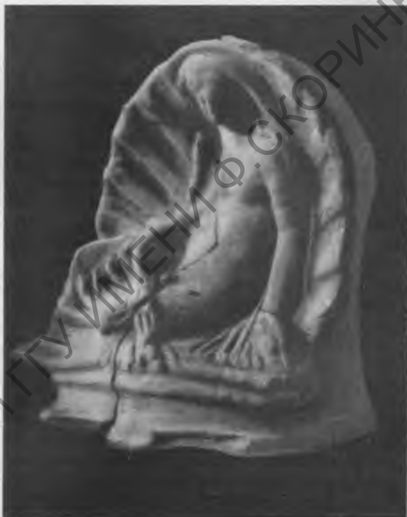
Рис. 6. Терракота из Калос-Лимена. Раскопки М. А. Наливкиной 1950 г.

Краевед А. А. Щ е п и н с к и й доложил о проведенном им в 1950 г. археологическом обследовании Курцово-Сабловской балки, богатой памятниками различных