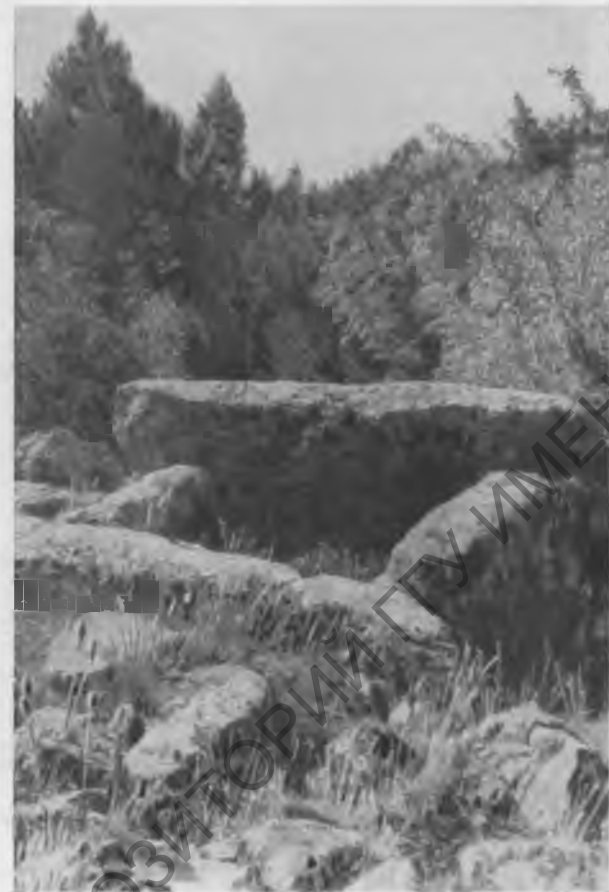
Рис. 5. Каменный ящик Таврского могильника на г. Кошка.

Разведочные раскопки Ялтинского музея и Крымского филиала на горе Кошка (руководитель работ П. Н. Шульц) обнаружили остатки таврского поселения, которое просуществовало от первой половины первого тысячелетия до н. э. вплоть до средневекового времени. Мощные стены (рис. 4) и следы хозяйственной деятельности тавров позволяют пересмотреть вопрос об уровне развития таврских племен. Отсутствие римских вещей и организация обороны приводят к другому важному выводу: не все южное побережье Крыма