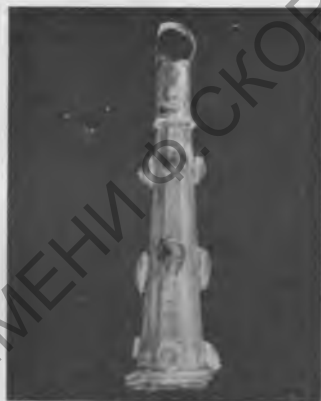
Рис. 3. Резная костяная пластинка и золотое украшение из Неаполя Скифского. Раскопки А. Н. Карасева 1950 г.

ных сооружениях Илурата, в частности в приеме утолщения стены путем наращивания поясов, можно усмотреть большое сходство со строительной техникой, применявшейся скифами в Неаполе Скифском и в других местах. О длительном сохранении некоторых местных обрядов и религиозных представлений говорит также культовый комплекс, открытый в Илурате в 1948 г., особенно культовые терракоты с характерными местными чертами и штемпель с изображением скифо-сарматской богини.