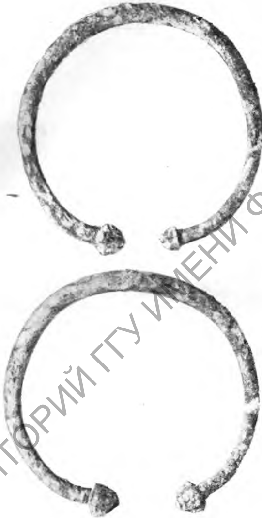
Рис. 4. Бронзовые браслеты из погребения № 1

ного сектора при повторной расчистке скальной корки погребений не обнаружено. Исследование насыпи кургана в процессе раскопок и по контрольным перемычкам показало полную однородность структуры насыпи. Курган был насыпан в один прием и был предназначен для центрального женского погребения. Обычай хоронить в ка-