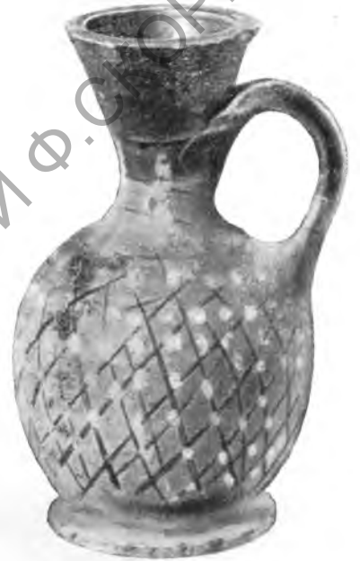
Рис. 6. Арибаллический сетчатый лекиф из погребения № 2

но связанный с Херсонесом, судя по курганной группе, с самого начала своего существования вступил в непосредственное соприкосновение с обитавшими здесь ранее скифами, которые и оставили близ города свой приморский курганный могильник. Одной из характерных его особенностей является типичный для крымских скифов обычай хоронить в каменных ящиках, засыпанных курганной насыпью.