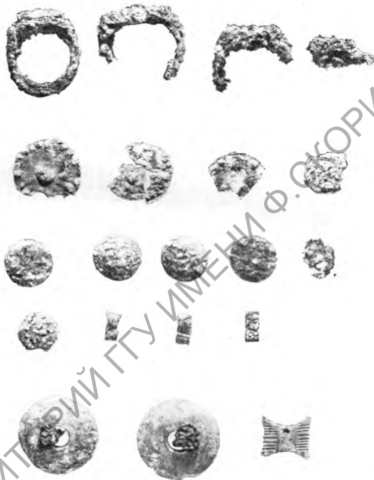
Рис. 3. Находки из погребения № 1

При зачистке контрольных перемычек в месте пересечения секторов ясно обнаружилась грабительская яма размером 2,70 \times 2 м. Разборка контрольных перемычек в центре кургана была произведена по контурам грабительской ямы. На глубине 1,60 м от вершины кургана на поверхности скалы, посыпанной морскими раковинами и песком, на подстилке из морской травы лежал женский скелет в вытянутом положении