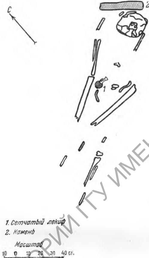
Рис. 5. План разграбленного центрального погребения № 2

руемого древнейшего культурного слоя городища Калос Лимен. Городище возникло, судя по находкам, на рубеже IV и III вв. до н. э. Погребальный обряд и инвентарь кургана № 1 носит типично скифский характер. Привозной греческой вещью является лишь один лекиф. Это позволяет сделать вывод, подтверждающий раскопки Л. А. Моисеева в 1929 г., о том, что черноморская курганная группа принадлежала скифам времени возникновения Калос Лимена. Этот небольшой портовый город, первоначально-